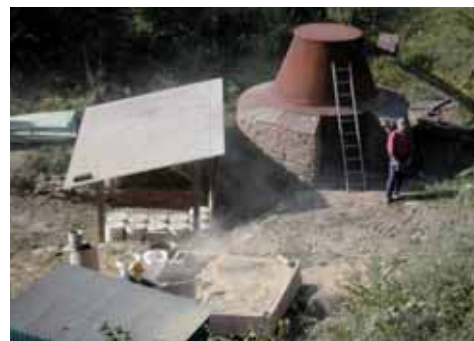
En kalkugn byggdes 1996 strax söder om slottsruinen för framställning av murbruk ur ölandskalken – det material slottet ursprungligen murades av.

Vid restaureringsarbetena har arkitekten i samarbete med SFV eftersträvat varsamhet gentemot byggnadsverket genom att det nybyggda ska kunna avlägsnas utan att skada monumentet. Man väljer tekniker som samverkar med byggnaden – en lågmäld gestaltning som tar hänsyn till ruinens specifika egenskaper. De nya fönstren har reflexfria glas utan karmar och är monterade direkt mot fönsteröppningarna i muren. De valda materialen – puts, ek och kalksten – är de traditionella.