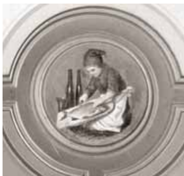
Detalj av en av takerundlarna med tomteflickor i hushållsbestyr.

i fest- och gästväningen. Rummen i de privata våningarna fick vänta. Restaureringen av Gustav v:s tidigare matsal blev det sista rummet som åtgärdades enligt de principer som fastställdes av Ivar Tengbom. Visserligen bevarades några av Fredrik Wilhelm Scholanders inredningar, men generellt uppfattades 1800-talets stilimitationer som smaklösa, överbelastade och ovärdiga i slottsmiljöer. Desto mer uppskattades nu 1700-talet, guldåldern för den svenska inredningskonsten och konsthantverket. Ovedersägligt uttalade man sig också utifrån en smakuppfattning som färgats av tjugotalsskandinavens ideal. 'Autenticiteten' blev också ett kvalitetsbegrepp. Begreppet har haft olika innebörd under olika tider och kan vara synonymt med 'original', men det kan också användas som klassificering av stil och utförande. Varför bevara stilimitationer när man i Slottet hittade de kvalitativt mest värdefulla inredningarna från 1700-talet? Många nedmonterade inredningar återfanns i slottsmagasinen. I praktiken blev det inte möjligt att vara stilhistoriskt konsekvent. Ivar Tengbom valde att åstadkomma en helhetsverkan där vissa estetiska kvaliteter lyftes fram.