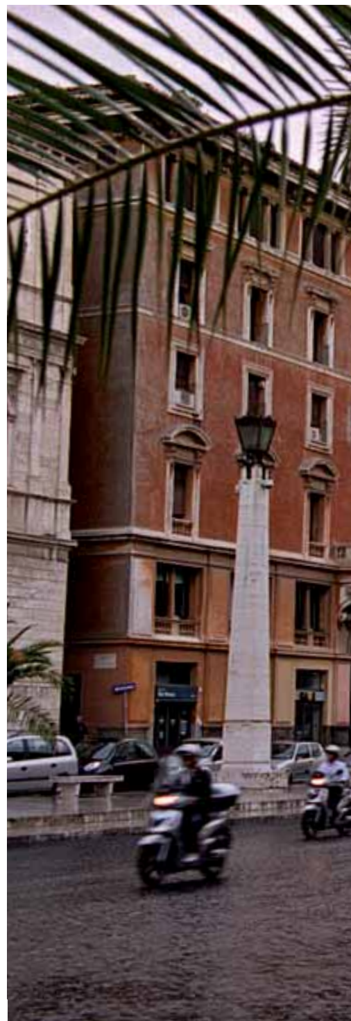
Mussolinis paradgata Via della Conciliazione, tidig morgon efter regn.

– Den övre solterrassen är säkert medvetet byggd för att inte synas, säger han.