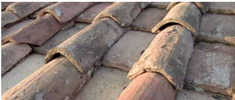
Detalj av Rominstitutets tak med kupade takpannor på rad.

– Fanns det ett dilemma i att bygga efter klassiska idéer med tanke på funktionalismen och dess krav på enkelhet?