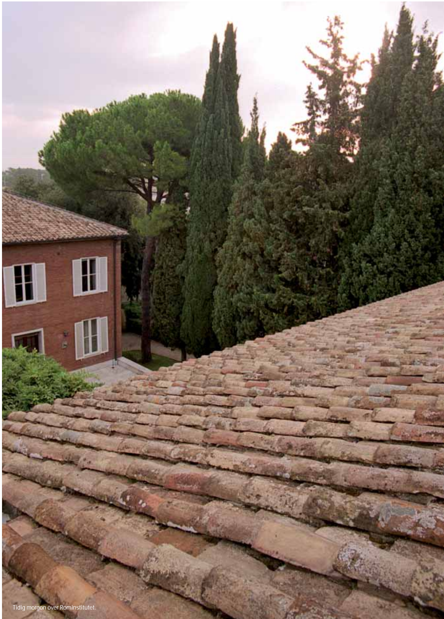
Tidig morgon över Rominstitutet.