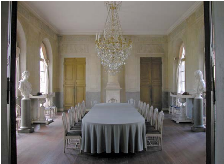
På 1840-talet genomgick paviljongen en in- och utvändig modernisering. Den fuktskadade matsalen fick vid detta tillfälle en pompejansk dekormålning av F. Hagedorn. Ragnar Hjorth valde att återskapa Gustav III:s matsal och avlägsnade därvid Hagedorns måleri.