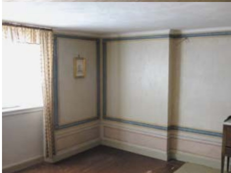
Då entresolvåningen avlägsnades 1868–69 skapades en ansenlig rumshöjd. Färgbilderna visar det genom spår i väggarna, på 1930-talet, rekonstruerade entresolbjälklaget.

ningens entresol avlägsnades med följd att trappan byggdes om, planlösningen förändrades och rummen nyinreddes.