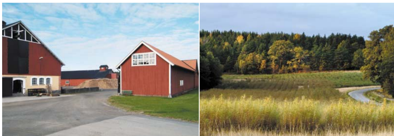
När Svartsjö tvångsarbetsanstalt övertog arrendet av kungsgården 1909 uppfördes nya ekonomibyggnader i anstaltens närhet. Byggnadernas arkitektur bevaras exteriört men de har anpassats för nya funktioner. Mellan byggnaderna ligger en hög med flis till värmepannan. Till höger. Svartsjö kungsgård klarar större delen av anstaltens energiförsörjning från egen odling av energiskog.

Året därpå började man med bifkor, en Herefordbesättning, som i dag består av cirka 200 djur. Varje djur följs individuellt och man noterar tillväxt, hur djuret ser ut, hur det mår och betar sig. Några går till slakt som unga, andra blir avelsdjur. De betande kreaturen gör en behjärtansvärd insats i gamla hagar som hålls öppna för att bevara det historiska landskapet och den biologiska mångfald som annars skulle gå förlorad. Man har ett nära samarbete med så-