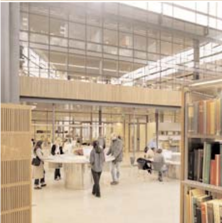
Ett triangulärt gårdsrum mellan två före detta laboratorielängor utgör i dag KTH:s biblioteks centrala bokhall.