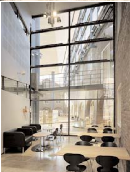
Den nya entrébyggnadens glasfasad speglar de omkringliggande röda tegelfasaderna.