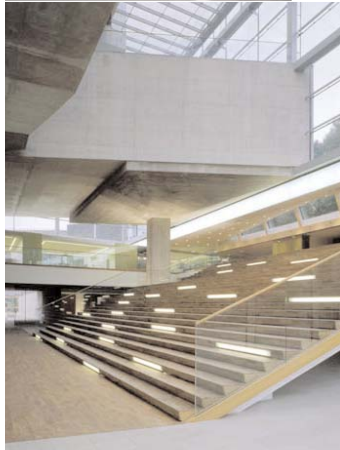
Årets Kasper Salinpris gick till Världskulturmuseet i Göteborg. Interiören i arkitektparet Brisac-Gonzales byggnad domineras av centralhallens väldiga trappa.