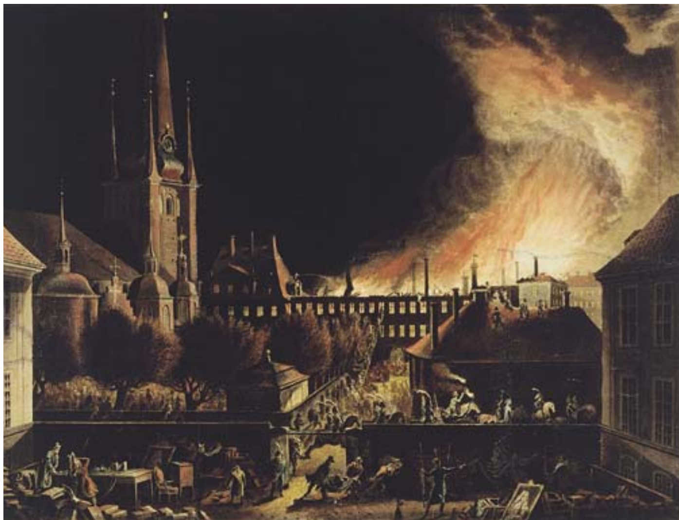
Branden i Cruusiska huset och Kungshuset natten mellan 15 och 16 november 1802. Längs bort till höger ses Kungshuset och dess södra flygel. Cruusiska huset som revs efter branden syns i fonden med taket helt avbränt. Oljemålning av Martin Rudolf Heland.

holm. Förutom Skokloster som han hade ärvt, erhöll han som belöning för sina krigiska insatser flera gods och skattehemman i Sverige, Finland och Pommern.