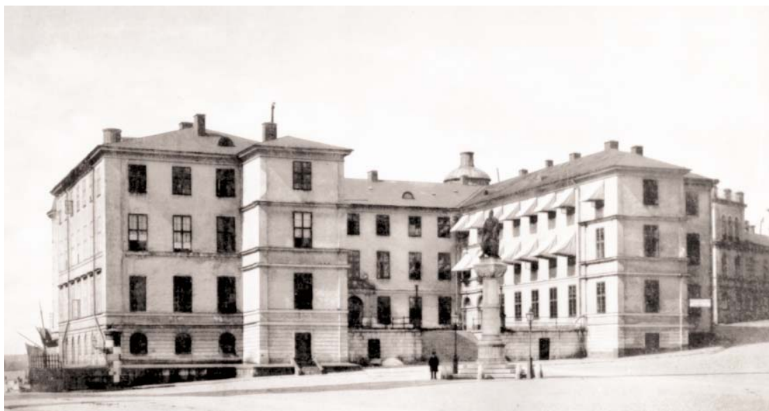
Palatsets utseende innan fyrkantstornens huvar rekonstruerades 1898.