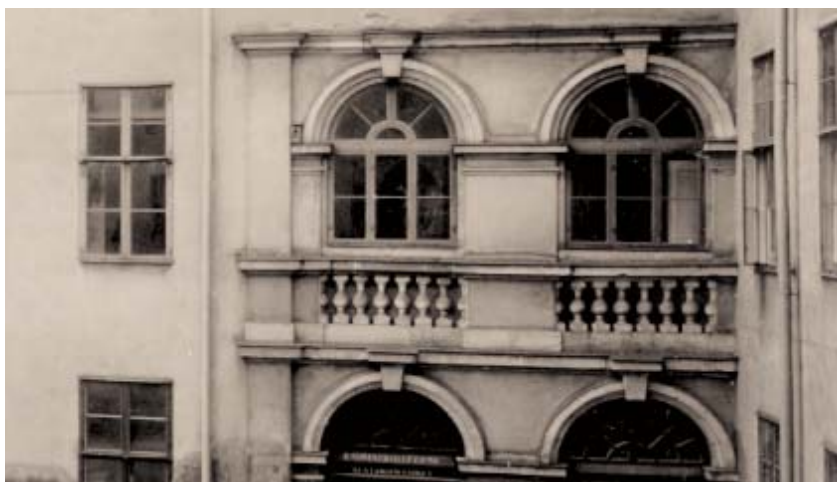
Trapphusen hade ursprungligen öppna loggior mot gården. Balusterdockorna murades in i fasaden som en kompromiss mellan arkitektens vision och anpassningen till klimatet.