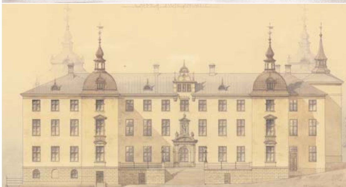
H. T. Holmgrens förslag till restaurering från 1892 var mer påverkat av nyrenässansen än av den tessinska arkitekturen.