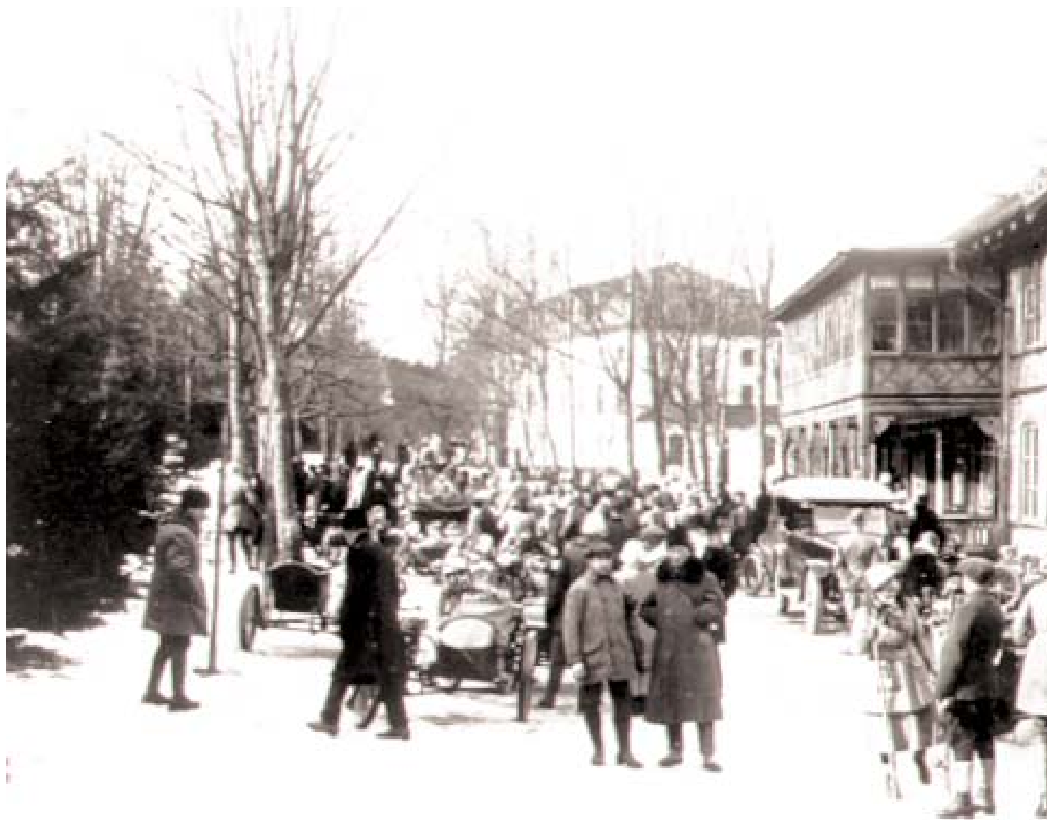
Folk har samlats framför värdshuset en vinterdag på 1920-talet. Att döma av sportbilarna till vänster rör det sig om någon form av motortävling. Genom de kala träden skymtar Confidencen i bakgrunden.

kutter och kärleksord. De tala också åtminstone på fönsterrutor och väggspeglar, fullristade med namn på dem som funnit herdestunden för ljuf att undgå ett förevigande. Så får glaset mottaga den minnesvärda bikten, att i detta nersuttna soffhörn sutto han och hon precis den och den dagen.»