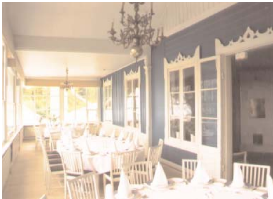
En trappa upp finns festväningen med både den stora inglasade verandan och små intima salonger.