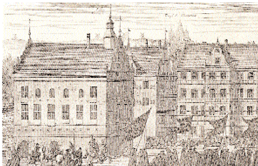
Järnvägen återgiven på Karl x Gustavs begravningsplansch 1660.