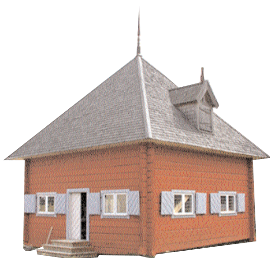
Den nya informationsbyggnaden vid Läckö.

Mer information finns på Läckö slotts hemsida: www.lackoslott.se