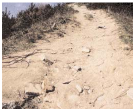
Där marken slits visar högen sitt inandöme av murdelar, tegelsten och kakelugnsspillror.

Den stora högen invid Uppsalavägen har en mer spännande historia än man kan ana. Den är till stora delar uppbyggd av rivningsmassorna från det kulturarv som skövlades i Klarakvarteren på 1960-talet. Södra delen av högen ingår i Hagaparken och förvaltas av Fastighetsverket.