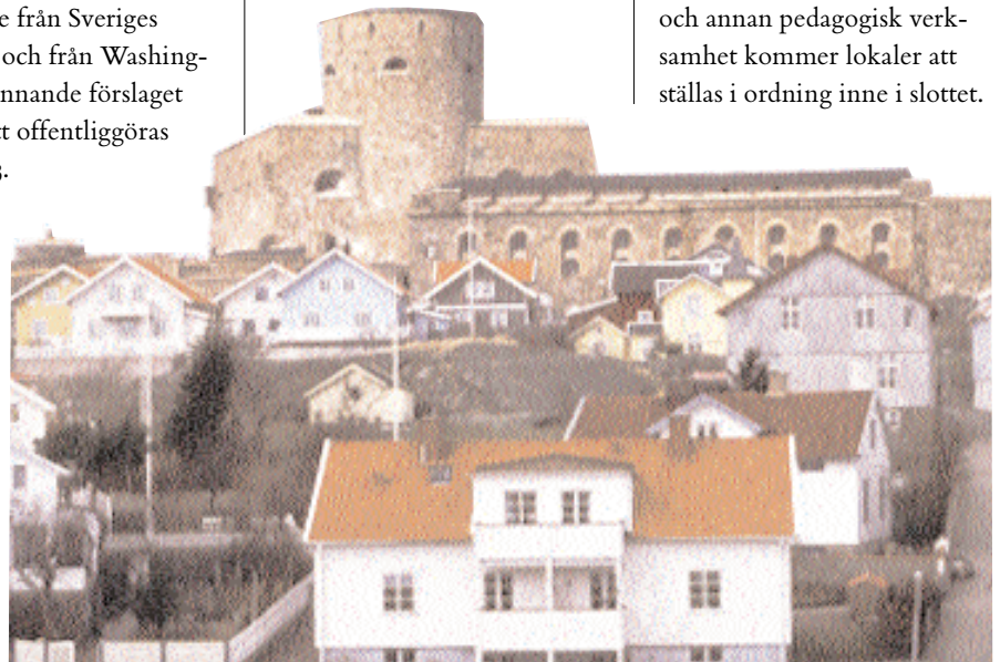
Carlstens fästning på Marstrand.

Därför planeras en ny administrations/entrébyggnad tillsammans med en ny parkering framför slottet. För framtida utökade satsningar på utställningar, föreläsningar, gästbud och annan pedagogisk verksamhet kommer lokaler att ställas i ordning inne i slottet.