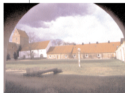
Bäckaskogs slott utanför Kristianstad.