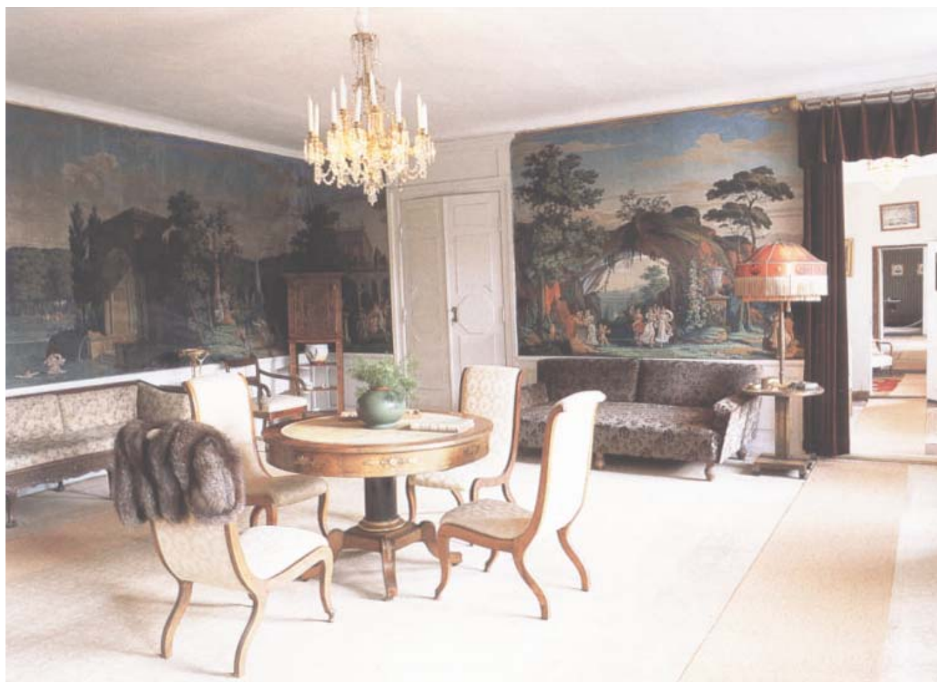
Salongen med sina exklusiva tapeter, tryckta av firman Dufour & Leroy i Paris vid 1800-talets början.