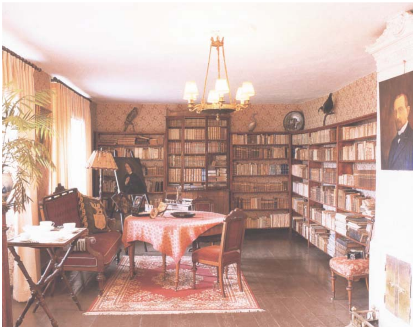
Det Ehrenborgska biblioteket som det ser ut efter restaureringen. Tapeterna på bilden är framtagna av Lim och handtryck i Göteborg och saluförs just som Hovdala bibliotek.

Nedan. Biblioteket som det såg ut vid Nordiska museets dokumentation 1961.