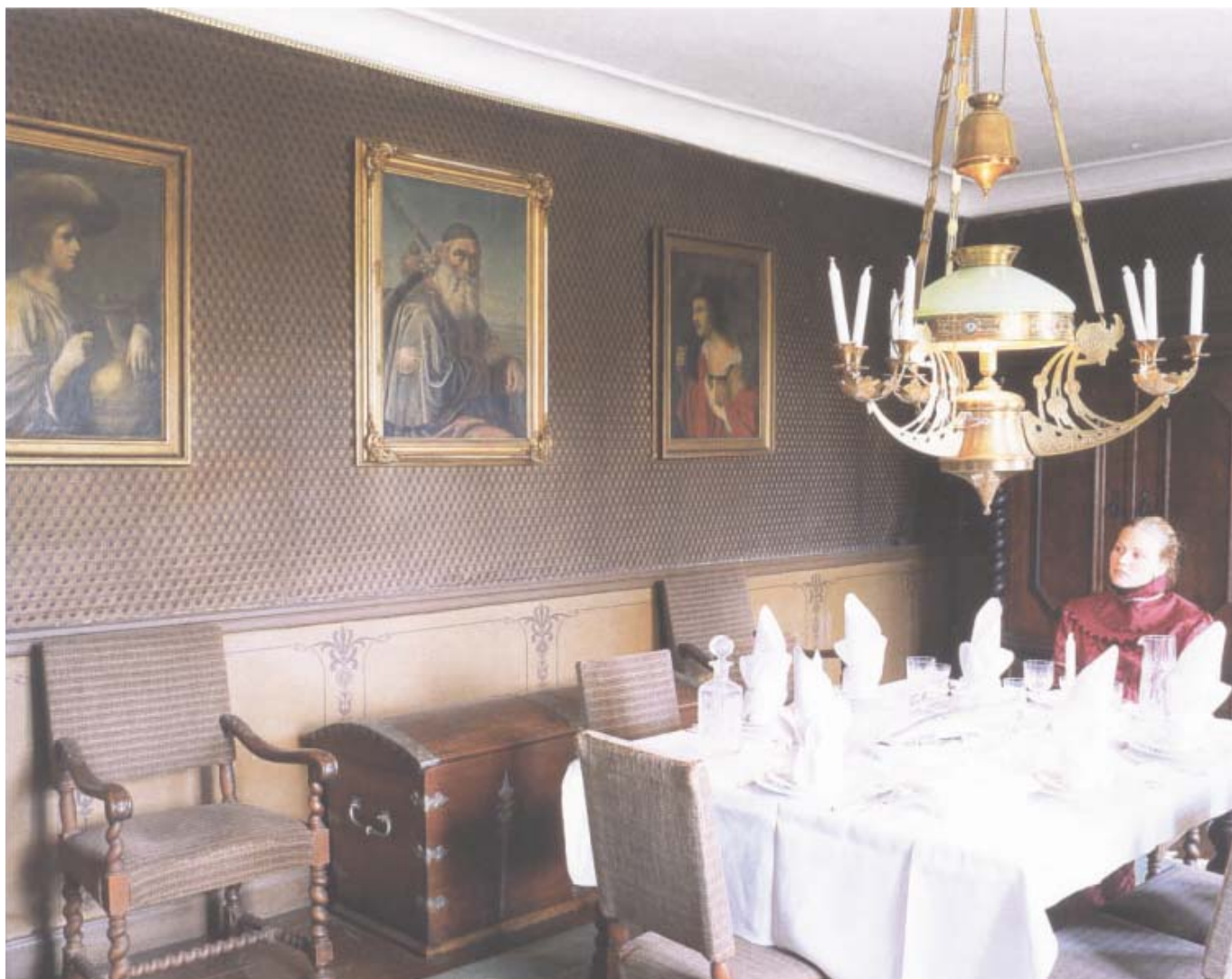
Då man som besökare vandrar runt i den östra längan känns det ibland som om tiden stannat. Under visningarna befolkas våningen av figurer som till synes omedvetna om betraktaren sysslar med sitt och tycks vara fångna i sin egen tid. I nya matsalen alldeles innanför entrén har man satt sig till bords under den magnifika jugendtakkronan.

ering 1944 var arealen 4 000 hektar. Omvandlingen av ägorna till militärt övningsfält innebar en våldsam ödeläggelse genom att mängder med torp, arrendegårdar och andra byggnader revs.