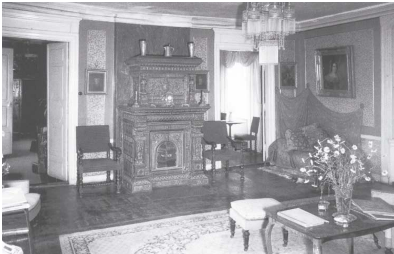
Gamla matsalen eller musikrummet 1961. Otto Lindblad, studentsångarnas grundare, besökte ofta familjen och musicerade just här med barnen Ehrenborg.