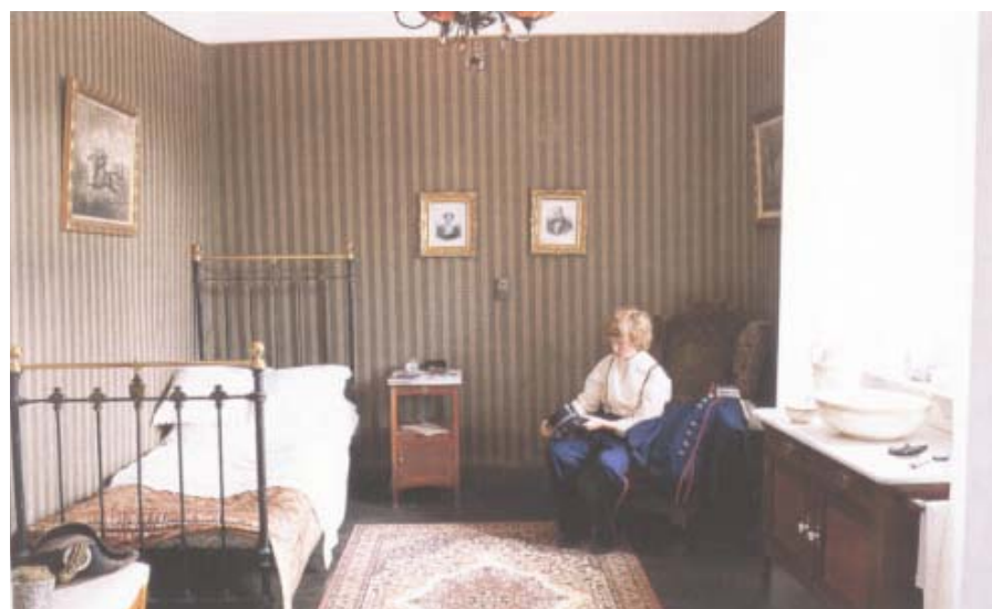
Ett av de två gästrummen som ligger söder om Vita salen. Detta är möblerat med en hälsning till alla militärer som besökt gården! Personen på bilden är en del av de ögonblicksscener som ingår vid guidningarna.