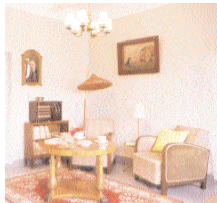
De 1900-talsmiljöer som bevarats eller återskapats ger en mycket påtaglig känsla av tidens gång.

Under visningarna befolkas den ehrenborgska våningen av figuranter som, likt gengångare, oväntat materialiserar sig i de tysta rummen där tiden har stannat.