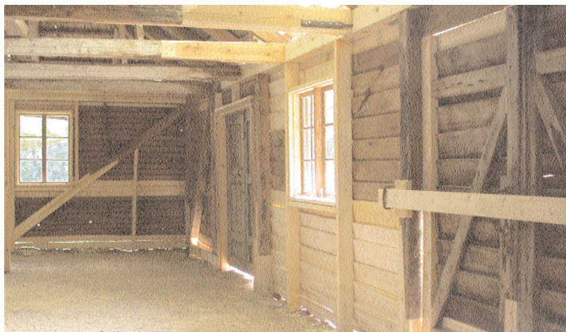
Vedboden var i mycket dåligt skick. De ljusa partierna är ilagningar.

Arbetena med att konservera Salstas delvis unika och högintressanta interiörer har återupptagits och kommer att pågå under hösten. Först på tur står Riddarsalen med sin gyllenlädertapet från sent