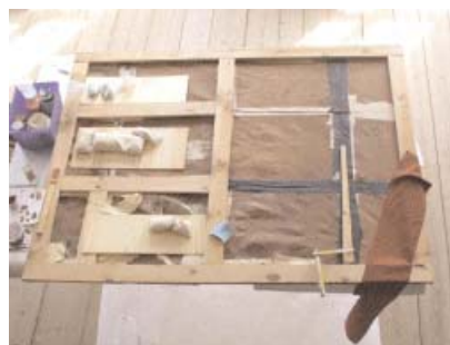
Bilder nedan. Riddarsalens gyllenlädertapet plockas ner och rengörs. Sprickor lagas med tyg färgat i samma grundton som tapeten.

1600-tal. Den plockas ner i delar, rätas ut och görs ren. Sprickor skarvas med tyg i samma färg som gyllenlädret, innan tapeten åter sätts på plats. Då man tog ner tapeten kunde man se att det inte var första gången den lagats. Det tunna lädret var omplåstrat med alla möjliga material och metoder, alltifrån gamla rullgardinsbitar och kontaktlim till mer antikvariskt försvarbara tillvägagångssätt.