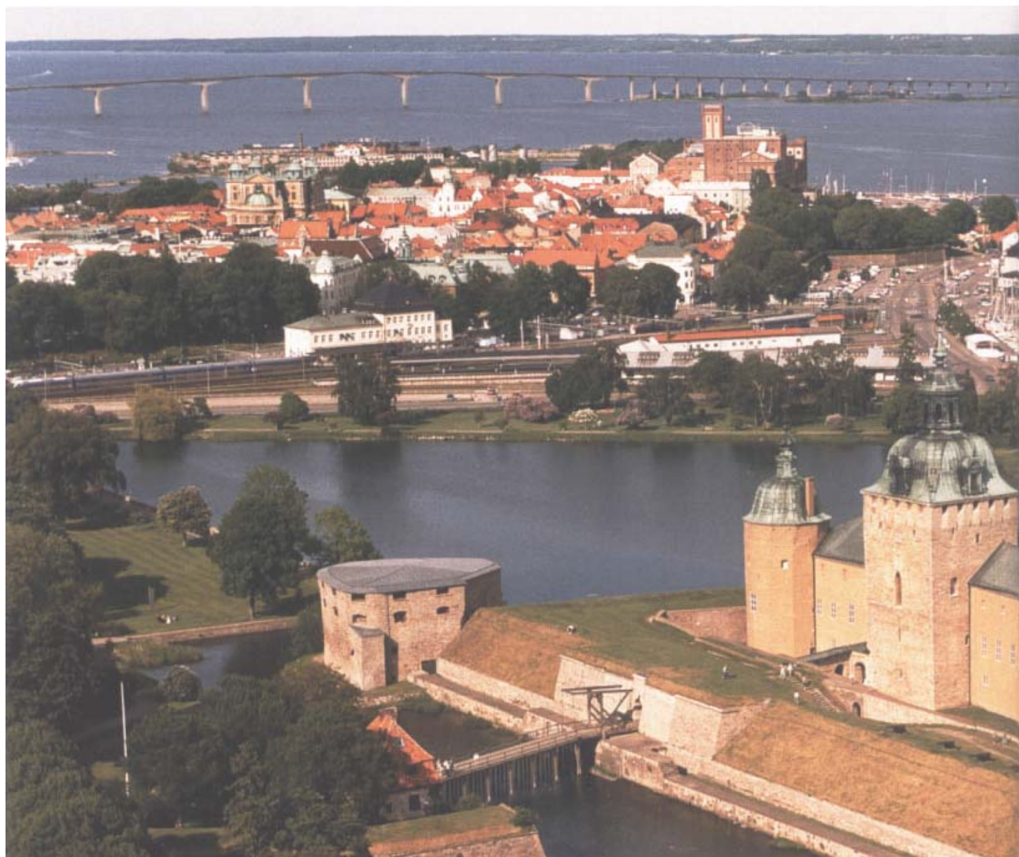
Vy över Kalmar från helikopter. I förgrunden ligger slottet och bakom syns Kvarnholmen dit den gamla staden flyttades på 1600-talet. Längst bort Ölandsbron, som förbinder Öland med fastlandet. I min ungdom fanns bara båtförbindelse, och varje resa var något av ett äventyr.

En nioårings tankar upptogs annars sällan av Sveriges förflutna, ärorikt eller inte, det handlade mest om något så konkret som fotboll. Det var en höjd-