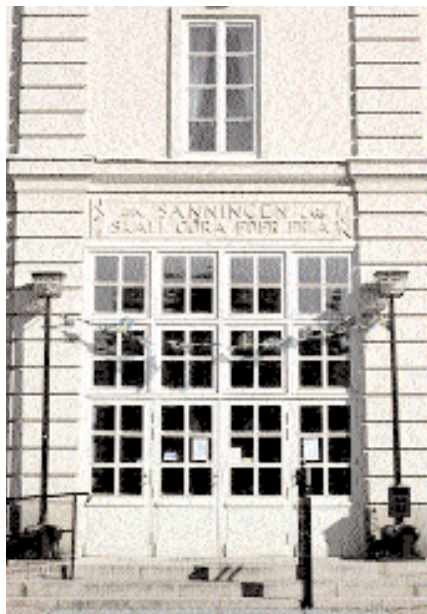
Huvudingången till Kalmar högre allmänna läroverk, Stagneliusskolan som det heter i dag. Byggnaden är uppförd efter ritningar av Ragnar Östberg. Kalmariter påstår att Östberg tränade sig på Stockholms stadshus innan han ritade skolan.