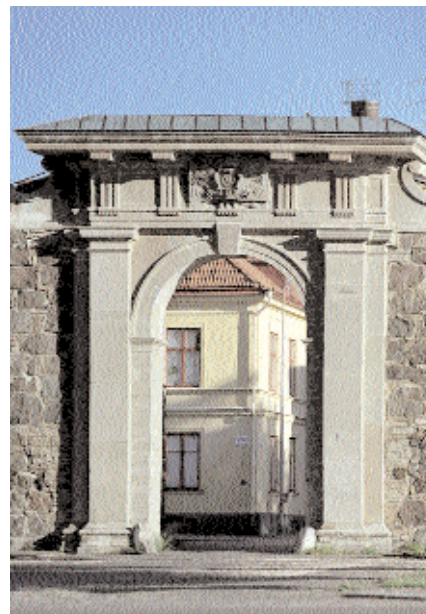
I Kalmar finns flera praktfulla byggnadsverk från stormaktstiden. Vid Stortorget ligger domkyrkan och rådhuset och bara några kvarter därifrån den vackra porten Kavaljeren som öppnar sig mot hamnen.

skall göra eder fria». Efter tåget genom staden följde det obligatoriska hissandet på Larmtorget vid Vasabrunnen. Då som nu var uppfinningsrikedomen stor när det gällde transportmedel för hemfärden. Jag skulle som i sagan fara på en flygande matta. Men man glömde att stötta upp mattan med något hårt underlag så jag försvann i en djup grop, helt osynlig för alla som stod längs färdvägen.