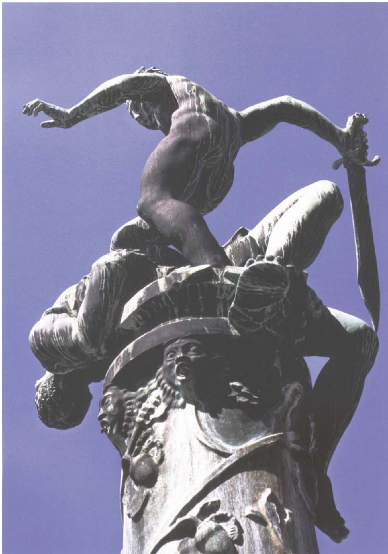
Vasabrunnen på Larmtorget. Gustav Eriksson Vasa landsteg 1520 vid Stensö söder om Kalmar efter att ha flytt från fångenskapen i Danmark. Brunnen invigdes 1926 av Gustav v.