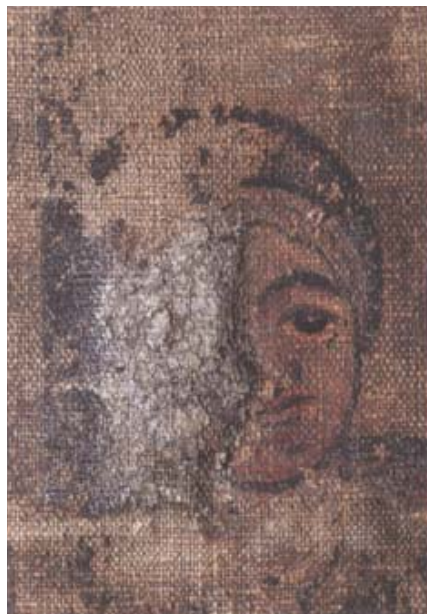
Målningarna är utförda i oljefärg direkt på väven utan föregående grundering. Det första steget i konserveringsprocessen var att tvätta bort övermålningen av limfärg och frilägga originalmåleriet.