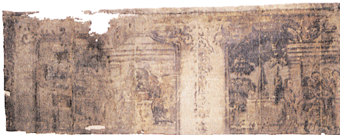
Väven med scen 7 och 8, som suttit längs rummets västra vägg, utlagd på konserveringsbordet ...

Några månader efter det att tapeterna monterats ned hittades ytterligare några våder i ett angränsande rum,