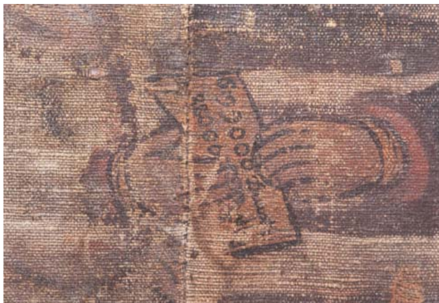
En detalj från scen 7 visar hur noga och realistiskt konstnären avbildat det kvitto på 90 000 dukater som Tobias lämnar fram till Gabel i Medien.

handling Den bildade smaken , att det fanns en uppdelning bland de som arbetade med tapetframställning. Dels fanns ämbetsmålarna som var förbehållna rätten att tillverka de oljemålade vävtapeterna, dels fanns tapetmakarna som var knutna till manufakturväveriet och tillverkade lite enklare tapeter. Till skillnad från ämbetsmålarna som tog upp sina beställningar direkt från kunden, arbetade de med en halvindustriell tillverkning för en anonym kundkrets. Ämbetsmålarnas tapeter målades för hand, ofta efter förlagor som kunden vid beställningen själv kunde välja från. Dessa tapeter anpassades till rummet, de målades på plats och räknades till husets fasta inventarier. De manufakturväveribundna tapetmakarna hade en verkstad där tapeterna antingen trycktes eller målades med hjälp av schabloner på papper,