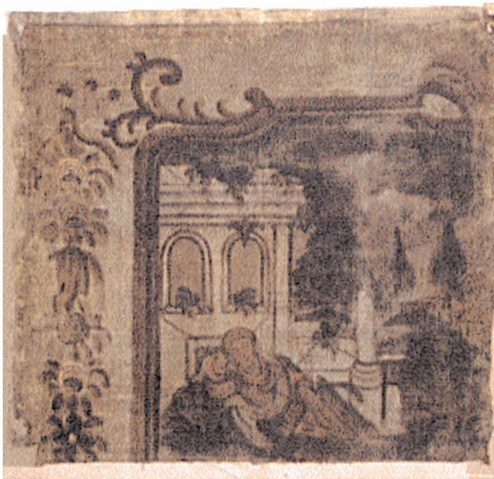
Scen 3. Tobit ligger och vilar utanför gårdsmuren med spaden i hand. Ovanför hans huvud flyger en sparv som inte är helt lätt att upptäcka. Den är lite valhänt målad och kan man inte historien är det lätt att förväxla den med ett ornament över det välvda fönstret. Spillning ses falla ned över Tobits huvud.