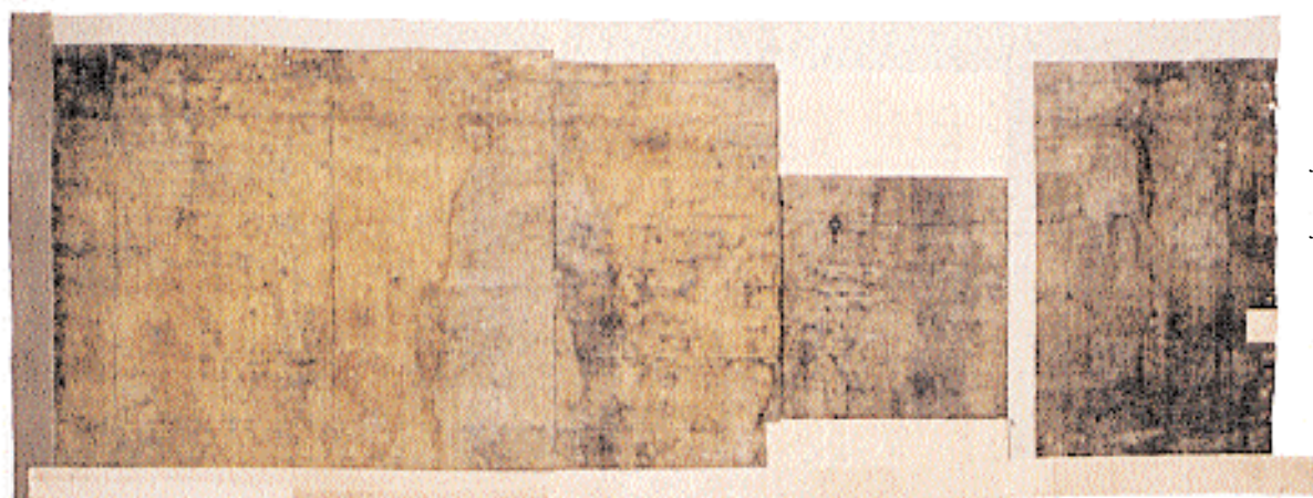
... samma väv från baksidan sedan hål och revor förstärkts med ny väv som fästs med Bevafilm.

Gud hör dem båda och bestämmer sig för att sända ärkeängeln Rafael till