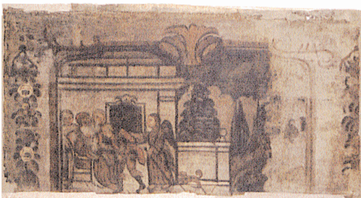
Scen 5. Tobias tar farväl av sin familj inför resan till Medien.