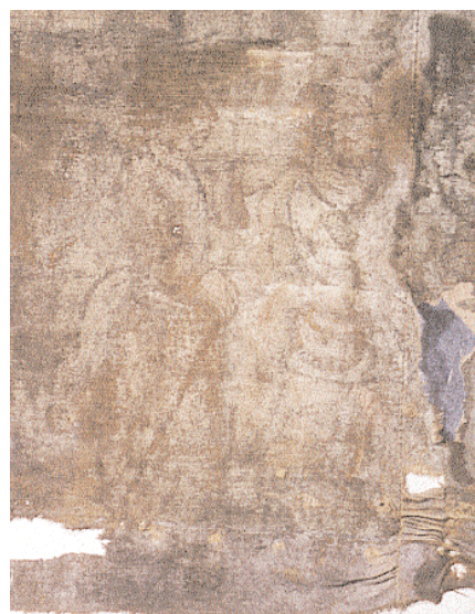
Vid nermonteringen var vävorna smutsiga och fulla av revor och spikhål. Vissa områden var dessutom fuktskadade. Detalj av scen 7 med Tobias och ängeln Rafael.

Vid nedmonteringen var våderna väldigt smutsiga – jord, mossa och gammal spillning från smådjur rasade