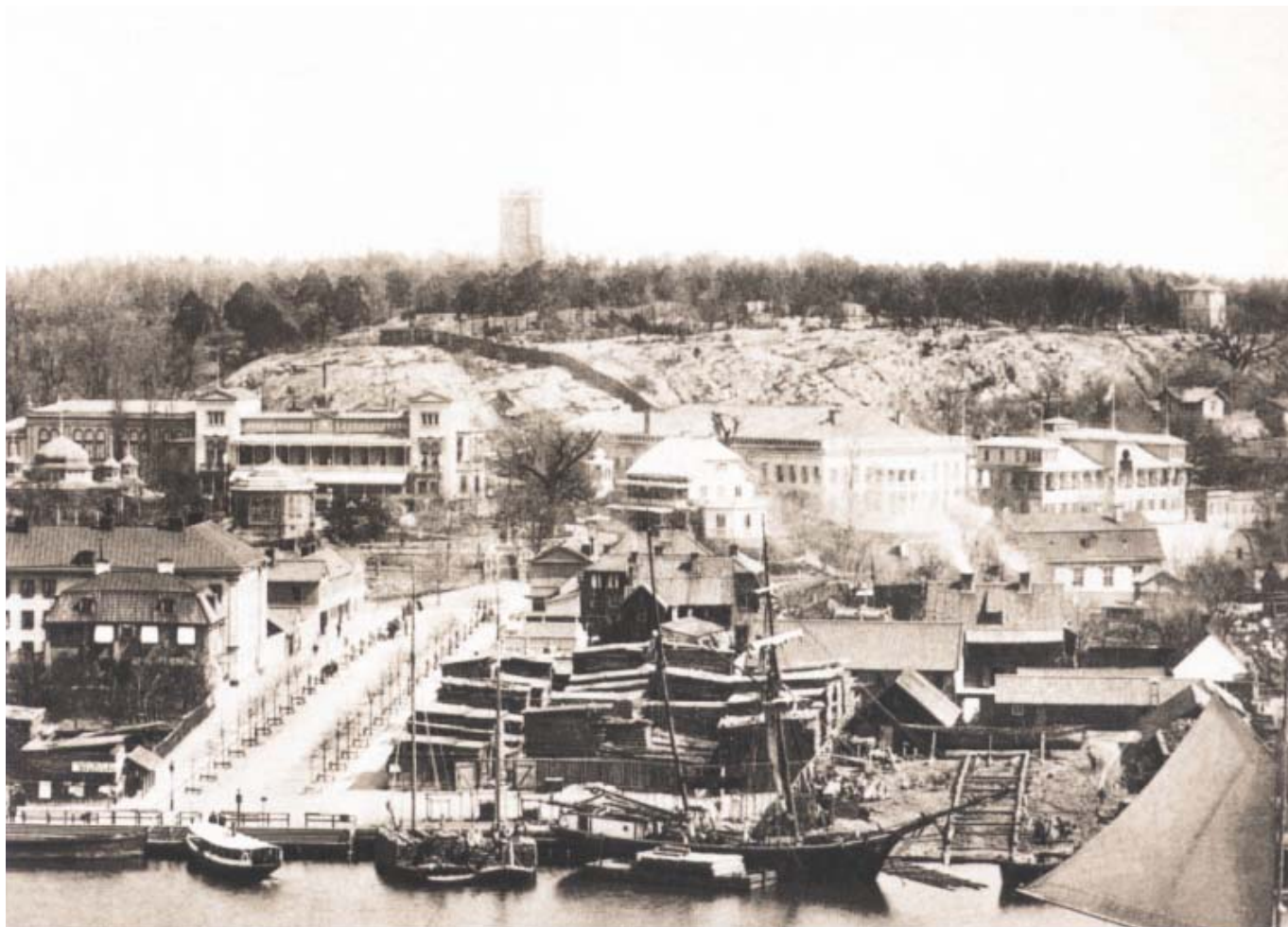
Utsikt över Djurgårdsstaden cirka 1880. Allmänna gränd har ställts i ordning och breddats men kvarteret Trädgården som upptar bildens högra del präglas fortfarande av en brädgård och skröpiga förråd. Det ryker kraftigt ur Mjölnergårdens två skorstenar och där bakom kan man ana Bellmanshuset och den förfallna trädgården.