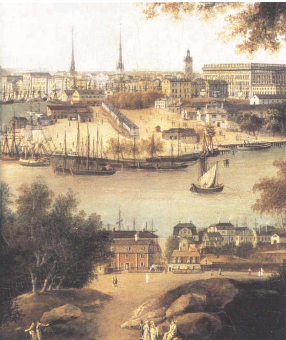
Utsikt över Djurgårdsslätten mot staden. Oljemålning av Louis Belanger 1812 (detalj). Konstnären står uppe vid nuvarande Hasselbacken och tittar ner mot Allmänna Gränd. Bakom husen till höger sticker masterna upp från fartygen vid Djurgårdsvarvet.

Parti av Djurgårdsvarvet, laverad pennteckning av Elias Martin cirka 1880.