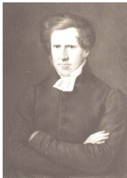
Anders Fryxell var lärare i Djurgårdsskolan och hörde förmodligen till de skolmästare som antas ha haft sin bostad i Bellmanshuset. Han blev med tiden en av de verkligt stora i den akademiska världen och har gått till historien som författaren till 'Ack Värmeland du sköna'.