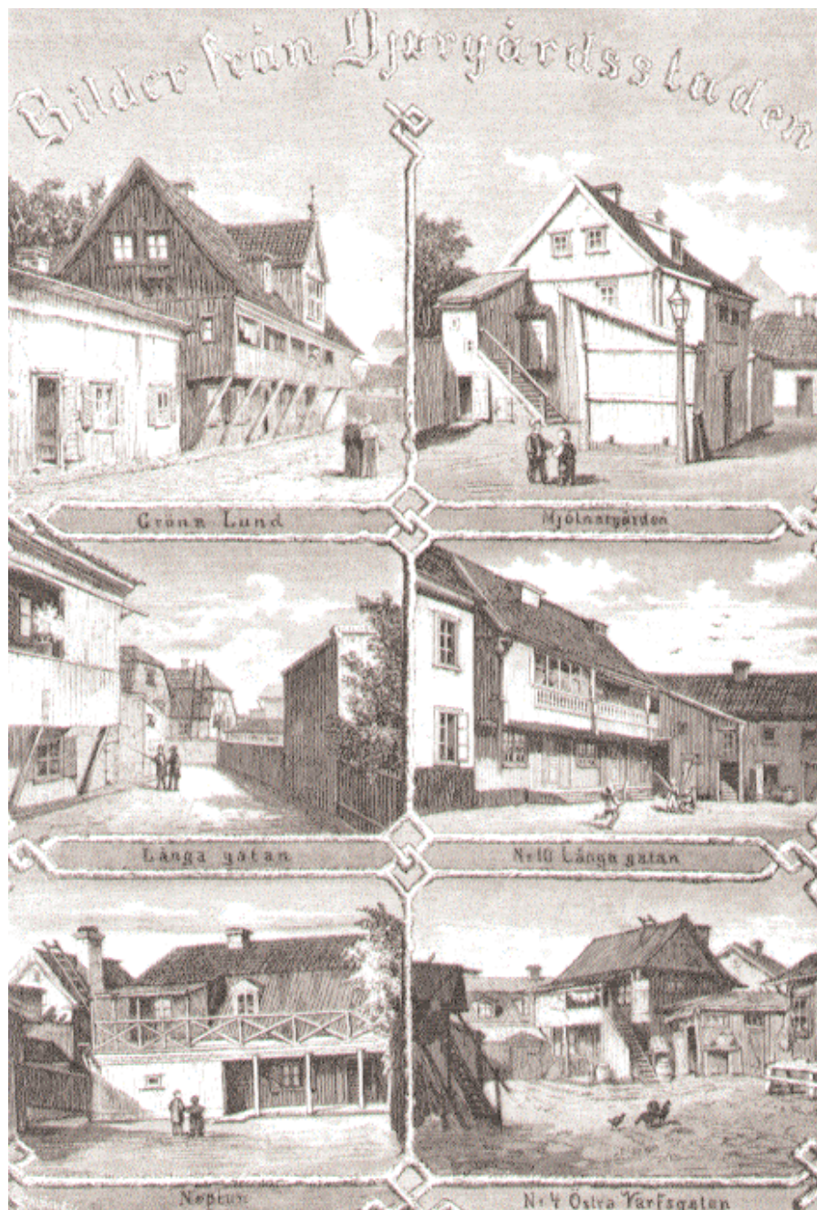
De lagar som reglerade innerstadens byggande kom aldrig att tillämpas i någon större utsträckning i Djurgårdsstaden. Här fick en romantisk kåkstad växa ohämmat med sina vinklar och prägl. Litografi i 'Ny illustrerad tidning' från 1800-talets slut.

Tillaeus ritade dels en kompromisslös stadsplan med en centralt belägen kyrka och rätlinjiga gator som inte tar hänsyn till topografin eller den bebyggelse som redan fanns, dels ett alterna-