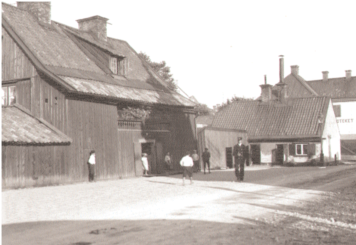
Mjölnergården från Lilla Allmänna Gränd vid förra seklets början. På bilden syns också den kapade östra flygeln och bakom den Djurgårdsvarvets chefsbostad som i början av 1900-talet hyste apoteket Vasen och som i dag är Gröna Lunds tivolis kontor. Mjölnergården var ursprungligen ett envåningshus, men byggdes på med en övervåning och den inbyggda svalgången vid mitten av 1700-talet.