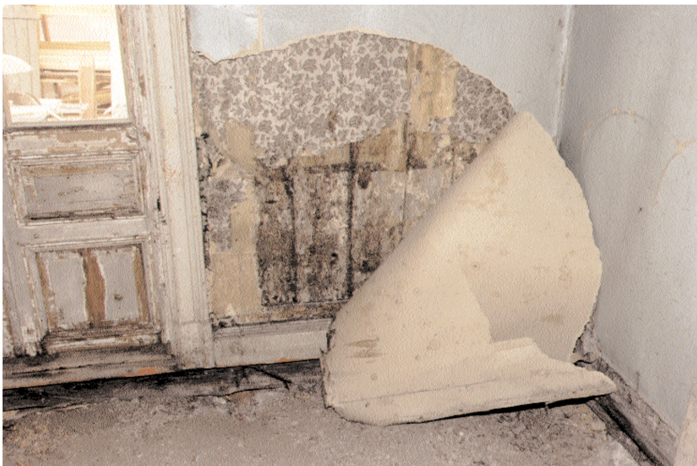
Under nyare tiders ytskikt kunde husets tapethistoria rullas upp i lager på lager ända in till de stänkmålade brädväggarna med sina målade bröstningar.