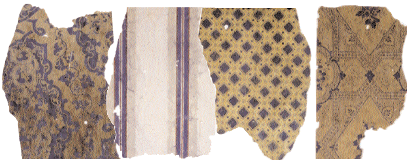
Ljust mellanblått storförigt damastmönster mot ljusbrun botten. Handtryckt tapet från 1850–60-talet.

Den äldsta tapeten satt i den låga längan söder om huvudbyggnaden, den var av lumpapper med i det närmaste utplånat handmålat bladmönster. Kanske kan den papperskonservator som nu fått hand om provet locka fram något av dess forna motiv. Utan byggnadsnickarnas intresse och uppmärksamhet hade vi nog inte hittat denna bit med dess två stämplor. Den ena är Stockholms hallstämpel, visserligen med årtalet utplånat men i övrigt lik en känd stämpel från 1756. Den kan med säkerhet dateras till tiden efter 1700-talets mitt. Den andra stämpeln har jag