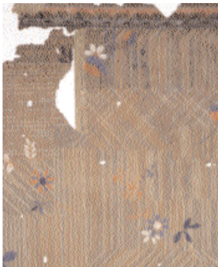
Japaninspirerad tapet med stiliserade blommor och våglinjer tryckt på brunt papper, sent 1920-tal.

nomfärgat papper. Många sådana tapeter finns i Bellmanshuset, men också sådana som är tryckta med två eller flera färger. Från 1870-talet och decennierna framöver finns många enkla tapeter, som kan ha passerat de boendes sociala status.