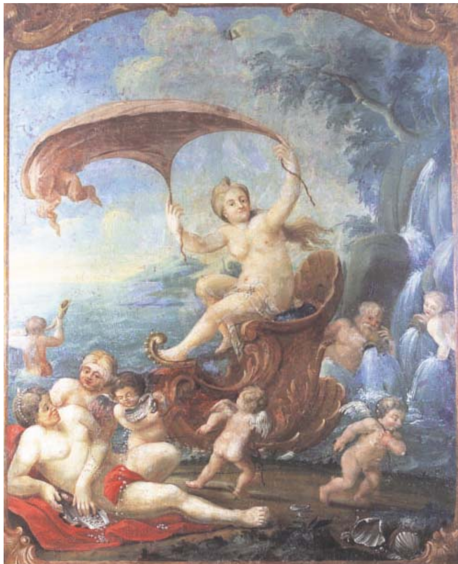
I Djurgårdsvarvets forna chefsbostad finns målningar direkt på putsen som är allegorier över de olika elementen och de olika sinnena. Målningen av vattnets element inspirerade Bellman till Fredmans epistel N:o 22 'Till de nybyggare på Gröna Lund'.