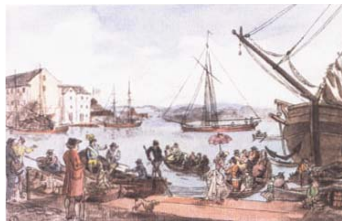
Ulla Winblad kliver i båten vid Roddartrappan. Akvarellerad konturetsning av Elias Martin 1787 (beskuren).