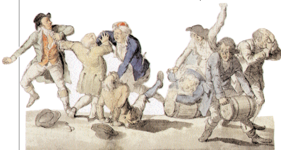
Akvarell av Pehr Nordqvist ca 1800 (detalj).

Texten för oss sedan in på krogen och låter oss, genom Fredmans inte alltid