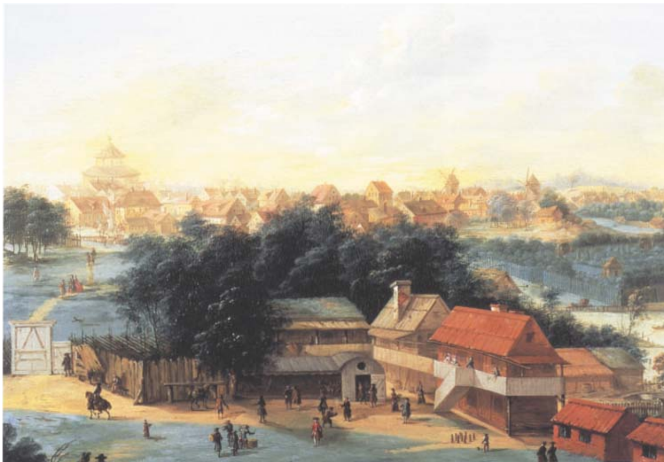
Vårdshuset Blå Porten på Djurgården. Oljemålning från 1730-talet tillskriven Griffier. Vårdshuset avbildas som ett konglomerat av olika byggnader där övervåningarnas svalgångar fungerar som korridorer till gästrum och privata smårum. På samma sätt kan man tänka sig att flera byggnader tillsammans utgjort Bellmans Gröna Lund.

nyktra ögon, betrakta krogstugans bemålade väggar och tak: