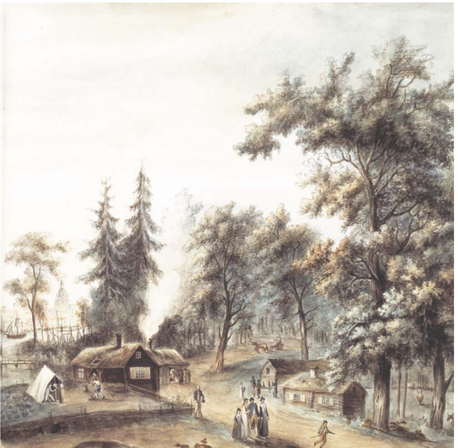
Väffel bruket vid Ryssviken, akvarell av Elias Martin (detalj). Djurgården avbildas som en pastoral idyll med lummig grönska och betande kor. Vid torpet bjuds dryck från en disk under bar himmel medan stadens torn och stenhus förtonar i fjärran.