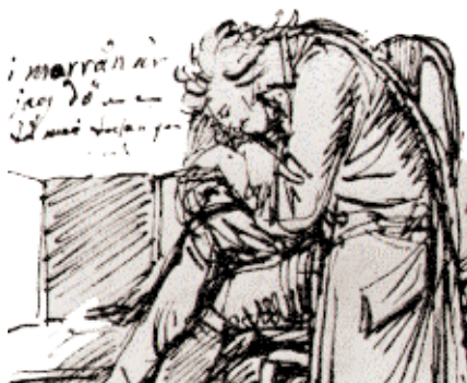
«I morrn är jag dö, ta mej tusan fan». Bellman dagen efter. Teckning av Johan Tobias Sergel, Göteborgs konstmuseum.