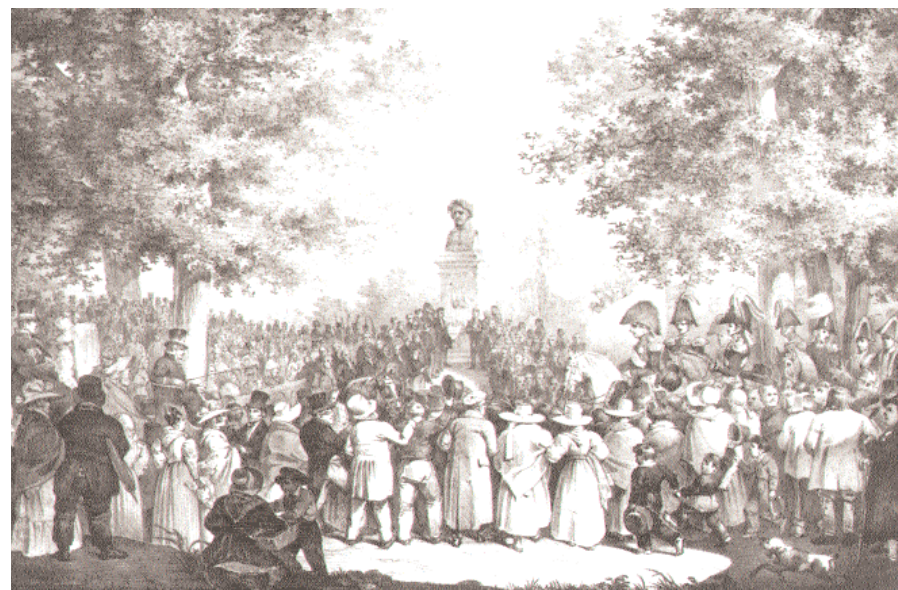
Invigningen av Bellmansbysten den 26 juli 1829. Färglitografi av Hjalmar Mörner.

Carlén är långt ifrån den enda som intresserat sig för Bellmans miljöer. En av de äldsta tryckta beskrivningarna av Djurgårdsstaden och kvarteret Trädgården hittar vi i J.E. Rydquists bok Djurgården förr och nu från 1833 :