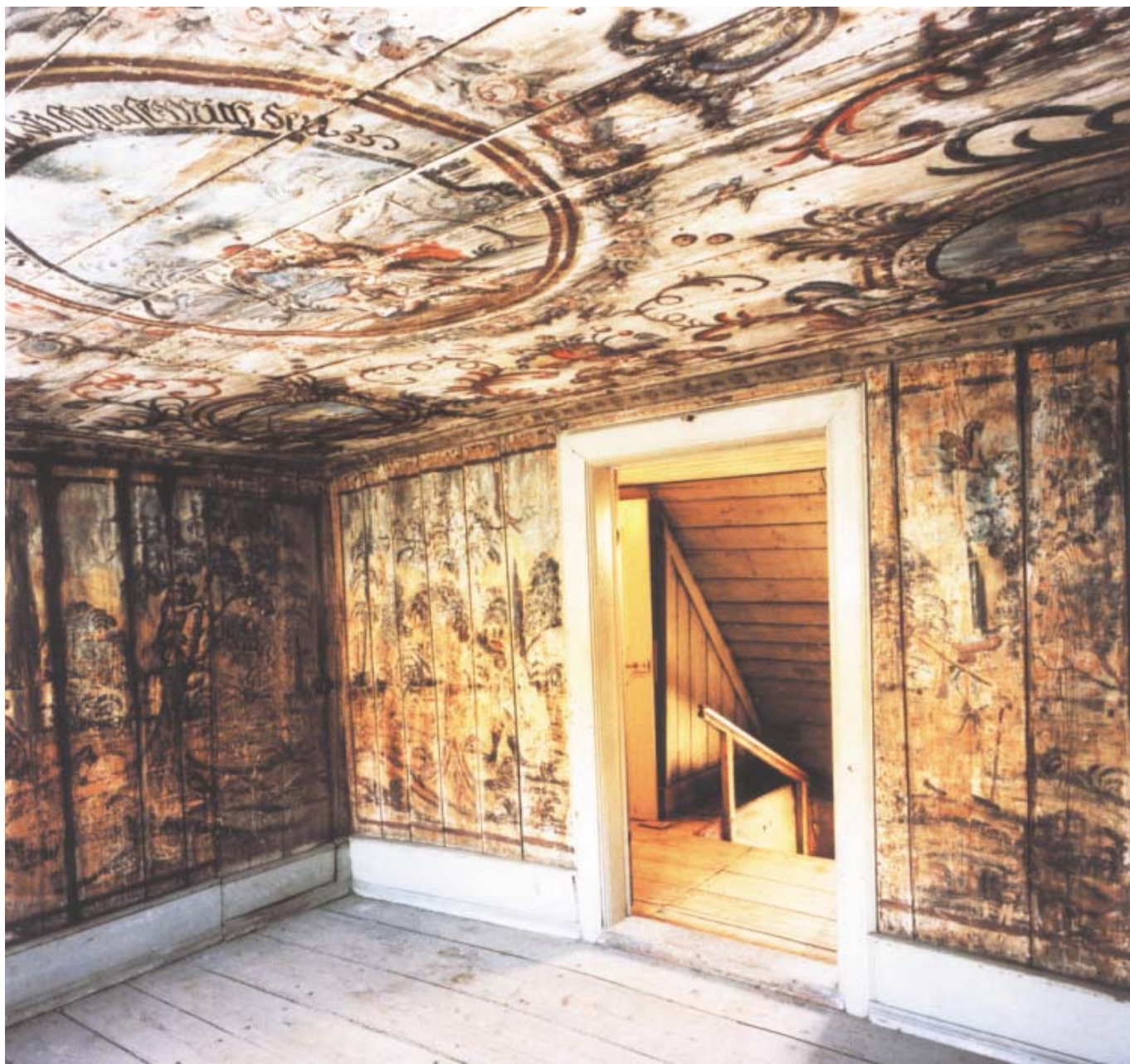
Målningarna i vindsvåningens frontespisrum upptäcktes under lager av tapeter på 1890-talet. Trots att motiven inte går att härleda till någon av Bellmans episteltexter togs upptäckten som ett bevis för att huset verkligen var Bellmans Gröna Lund.