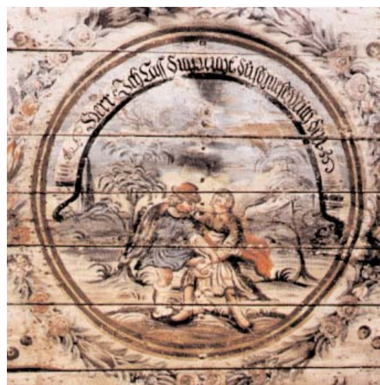
Takets mittmedaljong visar hur Jakob brottas med Gud.