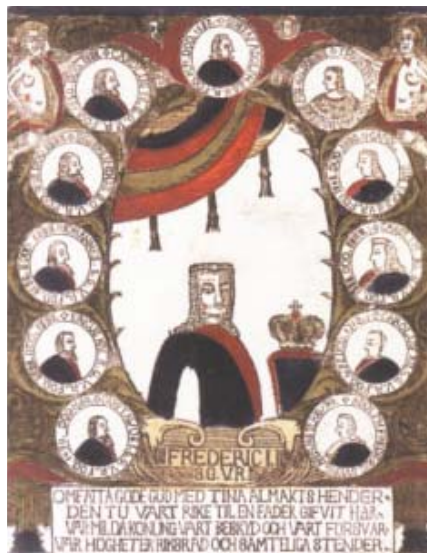
«Fredrik I och svenska konungars åminnelse», färglagt träsnitt av Petter Lorents Hoffbro. Hoffbros populära träsnitt fick så stor spridning att han fick ge namn åt en hel genre.

kade han färglagda träsnitt. Motiven var kungligheter, hjältar och förrädare, framställda i ett folkligt, naivt och ålderdomligt manér. Dessa målade 'brev' köptes av bönder och de lägre klasserna som hittills haft en begränsad tillgång på bilder. De blev enormt populära och fick mycket stor spridning. Långt efter Hoffbros död 1759 fortgick produktionen i hans namn. Bilderna blev så välkända att de kom att känneteckna en hel genre. Att Bellman i episteln attribuerar målningarna till Hoffbro bör således inte tas alltför bokstavligt utan mer som ett sätt att beskriva dem för den samtida åhöraren. Epistel nr 62 är inte den enda där Bellman nämner Hoffbros namn. I epistel nr 44 heter det till exempel: