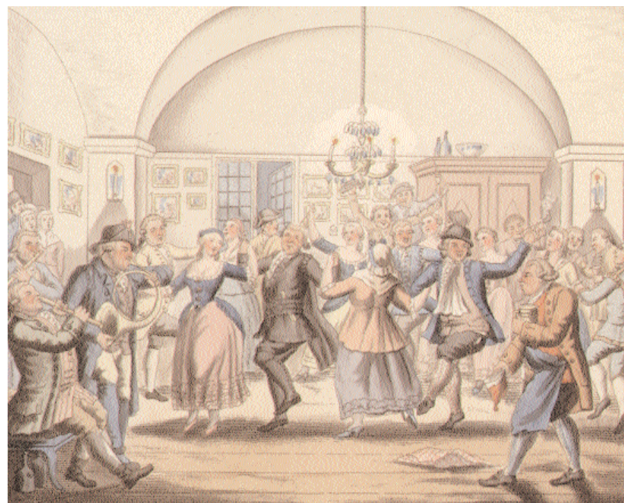
Ep. 62 'Angående sista balen på Gröna Lund'. Ur «Scener ur Fredmans epistlar och sånger», ett bildkomplement till Fredmans epistlar 1827 av tecknaren och målaren Elis Chiewitz. Här tar konstnären fasta på epistelns textrader som beskriver kroginteriören som välvd, vitlimmad och ljus. Året innan, 1826, utkom «Galleri till Fredmans epistlar och sånger» med ett persongalleri över Bellmansfigurer.

«... ett ställe av egen ryktbarhet: det af Bellman besjungna värdshuset Gröna Lund – i gamla tider ett sämre värdshus, numera blott ett ruckle...». Därefter kan man följa området och intresset för dess Bellmanskoppling i Djurgårdsbeskrivningar och Bellmansbiografier ända fram till våra dagar.