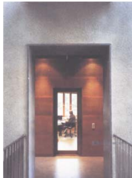
Nybyggnaden innehåller arbetsrum och framförallt många övningsrum för musikerna. Små nätta gångbryggor förbinder det gamla och nya huset, tvärs över ljusgården.