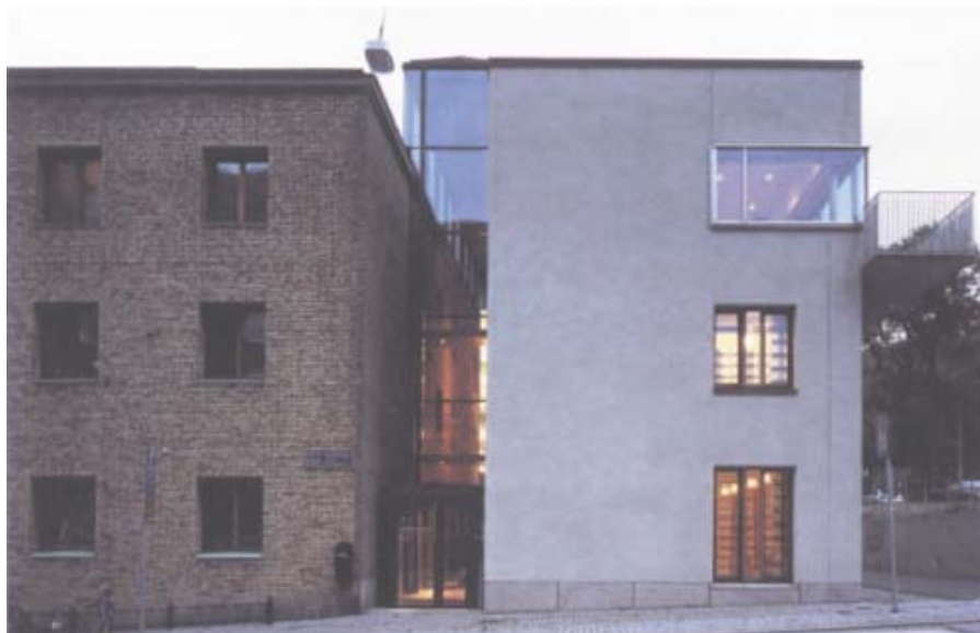
Nybyggnaden ansluter till konserthusets volym och fasadproportioner. Men genom att den är ljusst putsad lämnar den också konserthuset i fred. Personalkaféet högst upp, med hörnfönstret och balkongen, är ett välgörande avsteg från det ordningsamma.

Planlösningen anspelar på konserthusets former, material och strukturella uppbyggnad. Den smala ljusgården har gjorts öppnare med en stor gest som återklingar konserthusets akustiskt-funktionella utformning, tillbyggnaden fångar upp både det vänliga och det storstilade. En mycket vackert tänkt och skickligt utförd addition som inte bokstavigt utan mer metaforiskt ansluter sig och kommenterar det gamla husets väsen.» ■