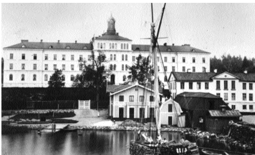
Manillaskolans huvudbyggnad uppfördes 1861–63 efter ritningar av professor Johan Adolf Hawerman. Bilden från slutet av 1800-talet visar byggnaden innan den höjdes med ytterligare en våning.