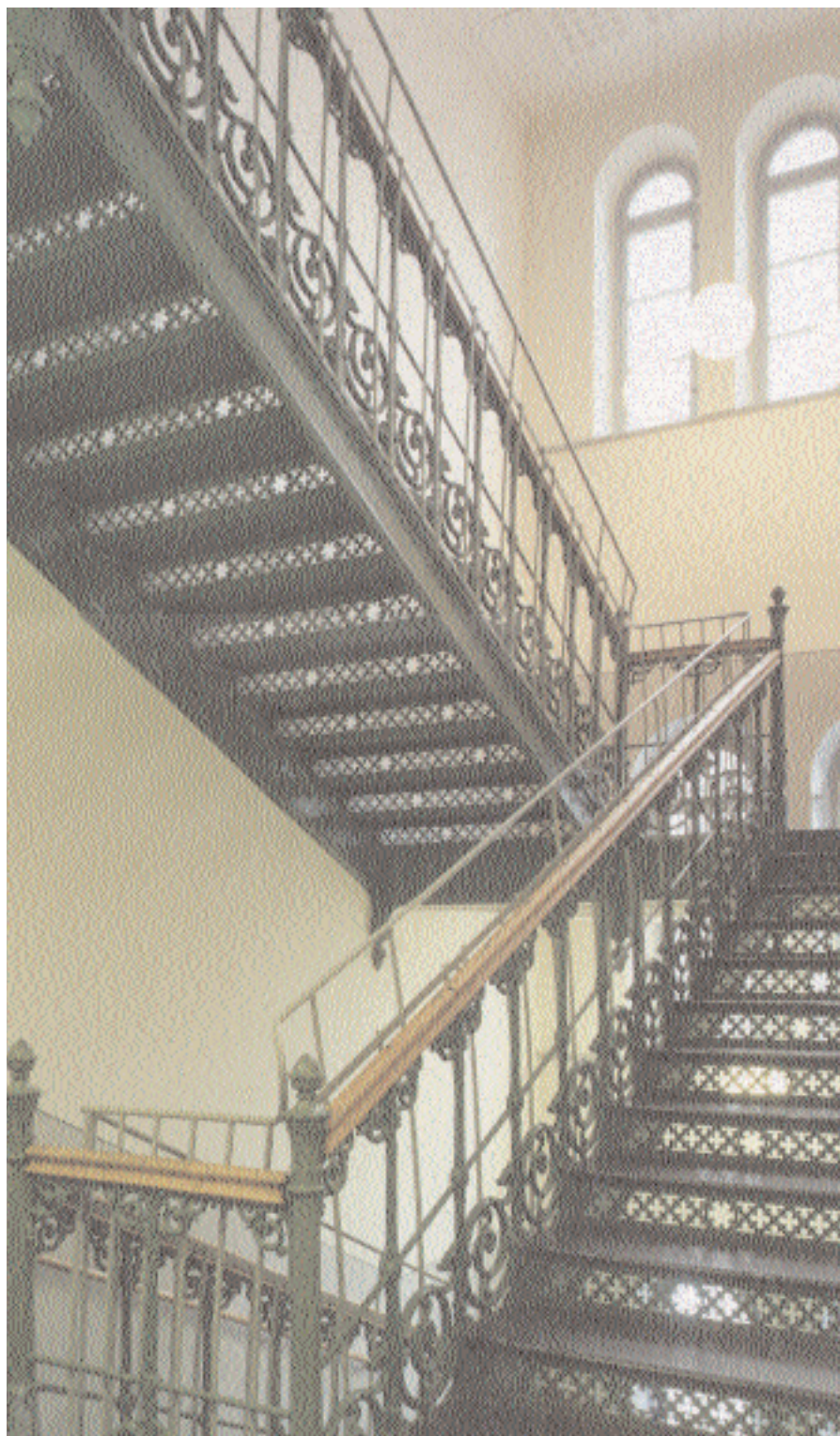
Ovan. Det centrala trapphuset bevarar en trappkonstruktion i gjutjärn från byggnadstiden.

Utvecklingen vid Manilla följer den generella utvecklingen för vårdinstitutioner under 1800-talet. Under 1700-talet fick fattiga och sjuka av alla kategorier i bästa fall hjälpligt tak över huvudet – fattiga och sjuka, barn och vuxna