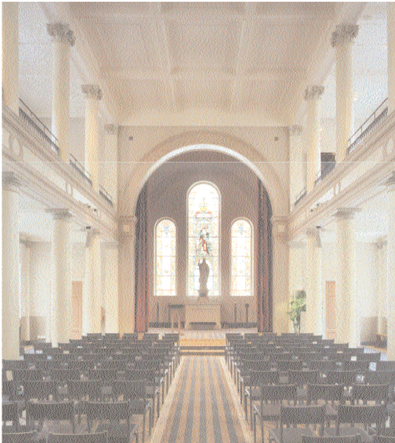
Manillaskolans kyrksal inreddes med donerade pengar från bland andra sångerskan Jenny Lind.