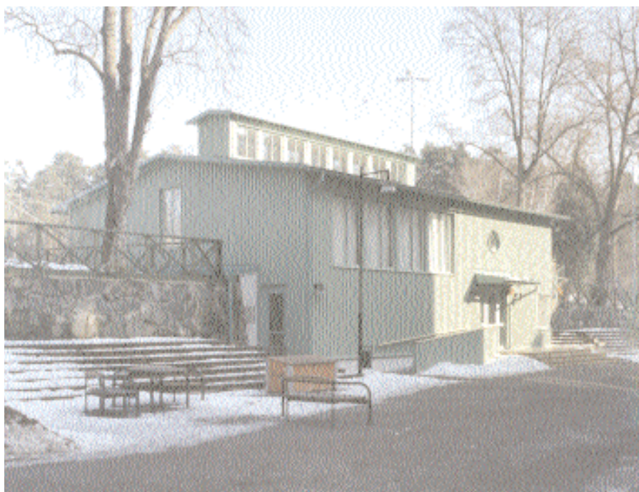
Dramahuset är ritat av Tallius-Myhrman Arkitekter och invigdes 1998.