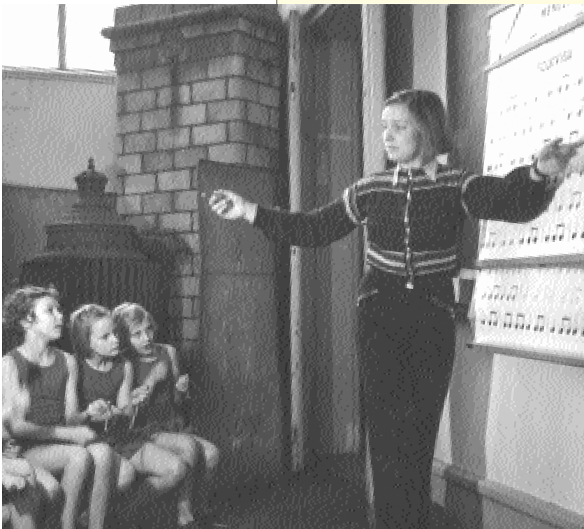
Bilder från skolans undervisning på 1940-talet.

Av ekonomiska skäl ansåg vissa ledamöter av riksdagen det vara angeläget att eleverna tränade upp sina språkliga färdigheter, «för att befrämja deras förståndsutveckling». Hantverk kunde de lära sig som lärlingar hos vilken smed, snickare eller skomakare som helst i landet, menade en motionär. Andra åberopade samma ekonomiska skäl för att undervisningen skulle inriktas på att lära eleverna ett yrke som de kunde försörja sig på, vilket också var Borgs uppfattning. Vid institutet förekom också undervisning i religion, räkning, geografi och astronomi, allt på åtbörds-