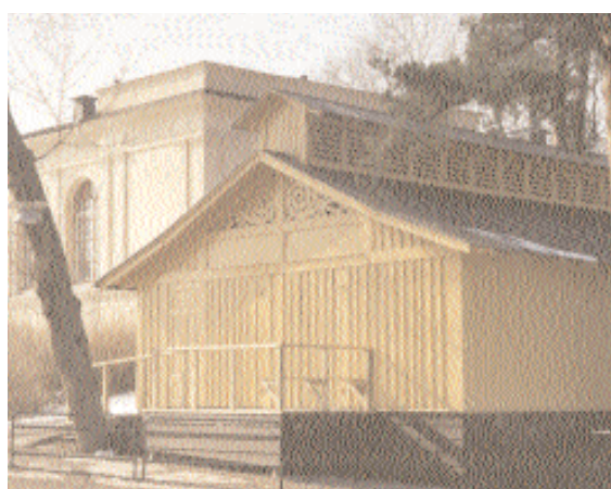
T.v. Det tidigare avträdet har fått en ny plats och funktion – nu som uppehållsrum för eleverna. I bakgrunden syns gymnastikhuset från 1870-talet.