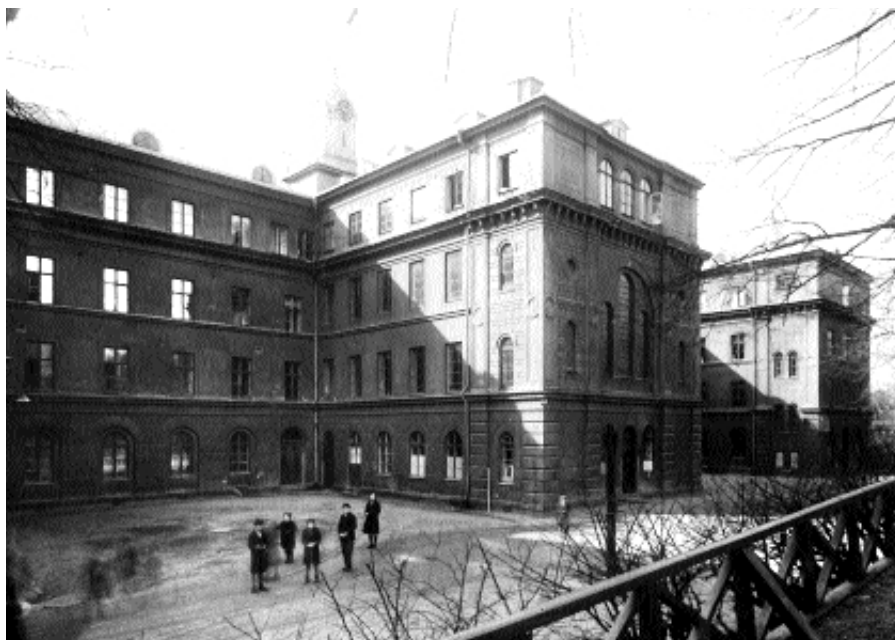
En bild från 1939 visar gården på skolans norra sida. Arkitekturen med rätställda flyglar fogade till en utsträckt huvudlänga är typisk för det sena 1800-talets institutionsbyggnader och skolor.