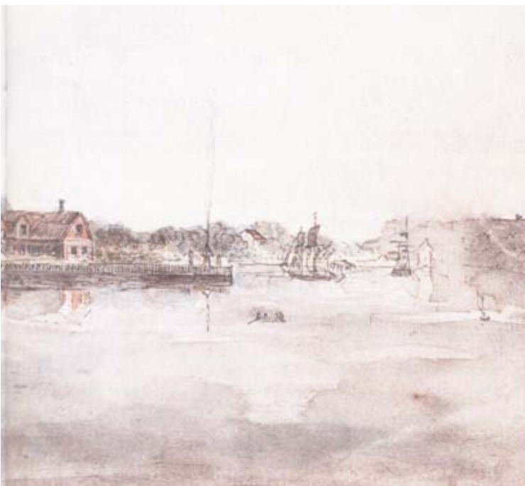
Utsikt mot Övre Manilla och Manilla holme. Akvarell från 1790-talet av Elias Martin.