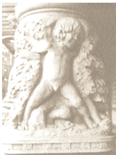
Gipsavgjutningarna har använts som förlagor till utsmyckningarna på kolonnkafsten på Dramaten i Stockholm.

Dramaten är ritad av Fredrik Lilljekvist och stod klar 1908. Flera av tidens främsta konstnärer anlätades för utsmyckningen av fasaden: Christian Eriksson, Theodor Lundberg, John Börjesson och Carl Milles.