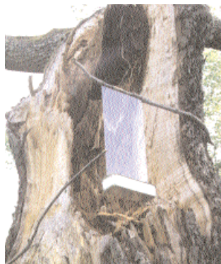
Skalbaggsfälla i gammal ek på Biskops-Arnö.

Fastighetsverket tillämpar Skogsbiologernas naturvärdes-inventeringsmetod. Det är en metod som poängsätter ett avgränsat område utifrån mängden naturskogsstrukturer, såsom grova eller gamla träd, döda träd i olika dimensioner, beståndets orördhet, påverkan av brand eller tillgång på lövträd. Hänsyn tas även till den terrängmässiga variationen och till förekomsten av andra naturtyper inom beståndet.