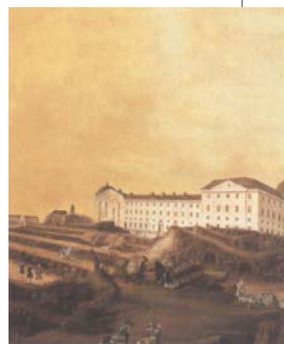
Uppsala slott i rosa på 1760-talet.