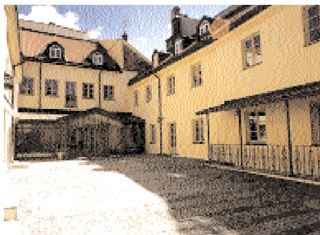
Priselönt ambassad i Vilnius.

Rosafärgad puts har hittats på fasaden vid igensatta fönsteröppningar. Den analyseras nu för att eventuellt kunna klargöra vilka pigment som användes vid slottets färgsättning på 1700-talet. Samtidigt diskuteras frågan om kulörval grundligt i ett brett expertforum.