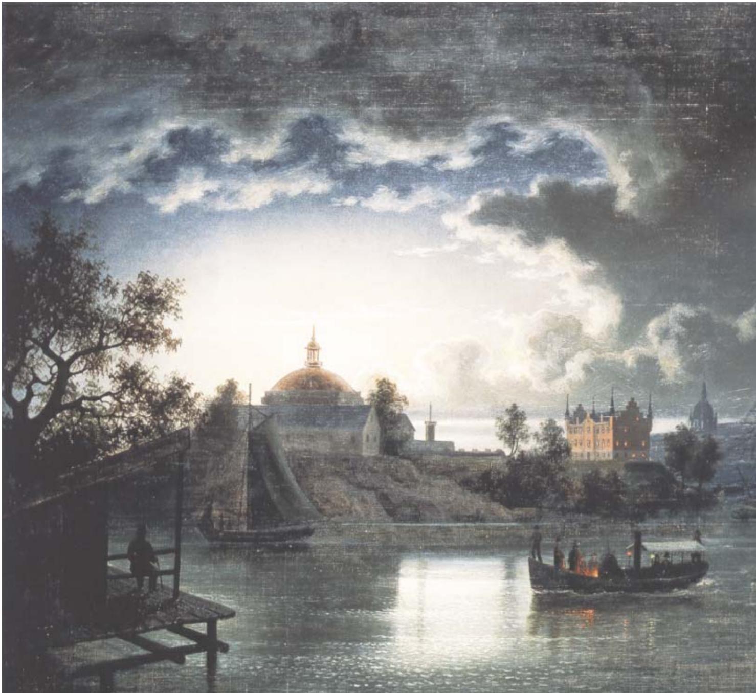
Skeppsholmen med Karl Johans kyrka och Amiralitetshuset. Oljemålning från 1850-talet i Stockholms stadsmuseum.

Holmkyrkan lög fram till 1822 på den plats där senare Nationalmuseum kom att uppföras. Till höger syns Skeppsholmsbrons landfäste. Teckning från slutet av 1600-talet av Erik Dahlbergh.