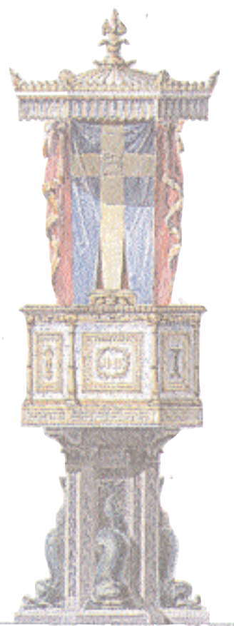
«Ritning till Predikstol i Carl Johans Kyrka å kongl. Skeppsholmen Stockholms Station af Kongl. Maj:ts Flottas Mekaniska Departement den 10 Mars 1843, F. Blom»

seet. Berggrunden var fördelaktig ur ekonomisk synpunkt och Coyet framförde även estetiska motiv. «Förutnämnda lokal, som till alla sidor är fri till utsikten» framförde han i sin skrivelse, «erbjuder ett för huvudstadens förskönande ypperligt tillfälle att där anlägga en kyrka av första rangen», med plats för omkring 1 600 personer.