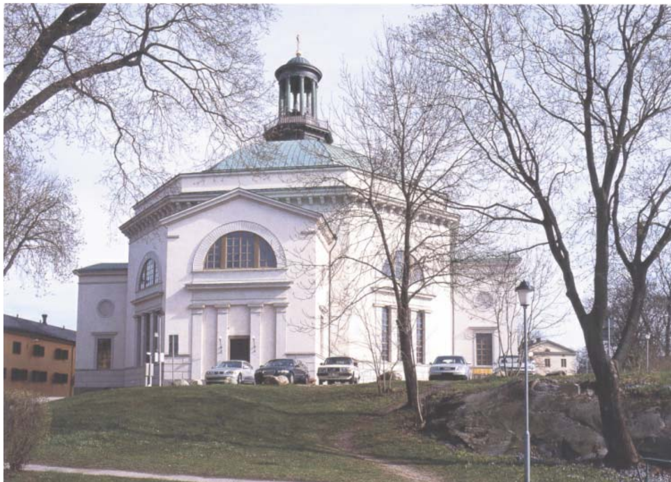
Kyrkan återfick sin ljusa kulör i samband med Fastighetsverkets fasadrenovering 1998.

mitt interfolierades med arkivolt och kolonner. Predikstolen placerades strax framför två kolonner väster om altaret. De stora ofärgade fönstren, som vetter åt alla väderstreck, ger fortfarande det jämna och klara ljus som är en av centralkyrkans fördelar.