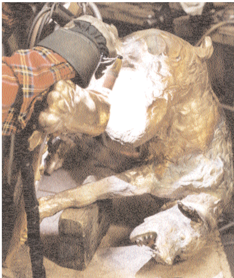
Neptunus hund finjusteras i baken.