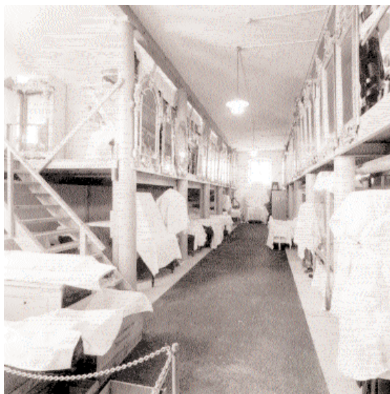
Under perioden som magasin för Kungl. Husgerådskammaren fylldes det gamla stallet av möbler och allehanda bohag.