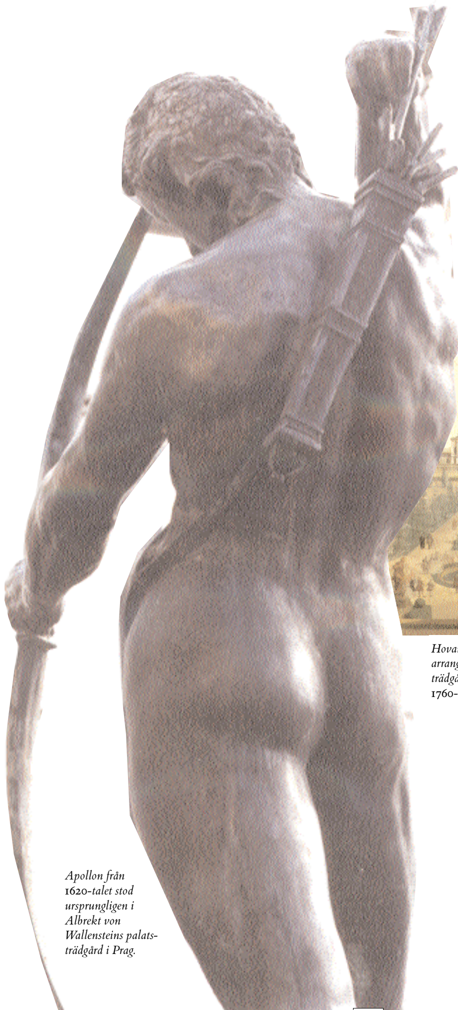
Apollon från 1620-talet stod ursprungligen i Albrekt von Wallensteins palats-trädgård i Prag.

ge allmänheten tillgång till brons-skulpturerna, och den ena halvan av bottenvåningen ställdes i ordning som skulpturmuseum. Rummet rensades så långt möjligt från 1954 års tillägg – bara trapphuset och elverket inkräktar nu på utställningsrummet. Pelarsalen ser åter ut som den gjorde under stalltiden, endast spiltorna fattas. På pelarna syns var hästarna sparkat och gnagt.