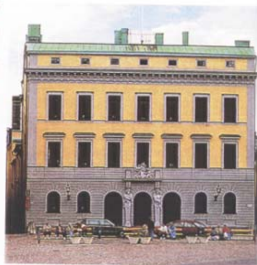
Trosska palatset idag.