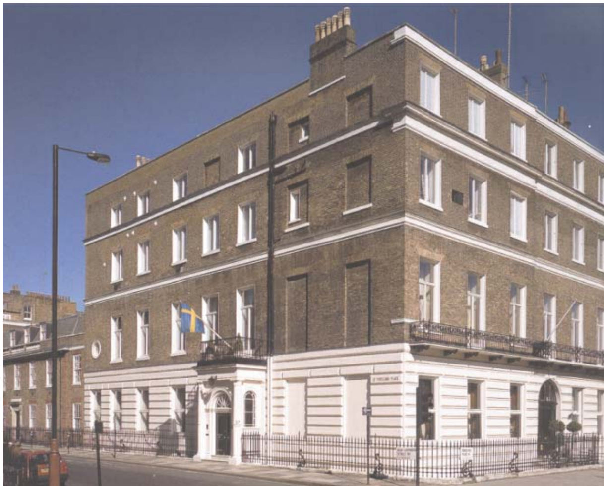
Residenset i hörnet av New Cavendish Street och Portland Place. Byggnadens yttre ger ett relativt anspråkslöst intryck.

rundad portik (All Souls) på Langham Place där gatan krökte, för att på så sätt ge liv åt vad som annars kunnat bli en klumpig lösning. Regent's Park är än i dag en av Londons mest uppskattade parker och Portland Place behöll på detta sätt den utblick mot grönska som det var tänkt att den skulle ha.