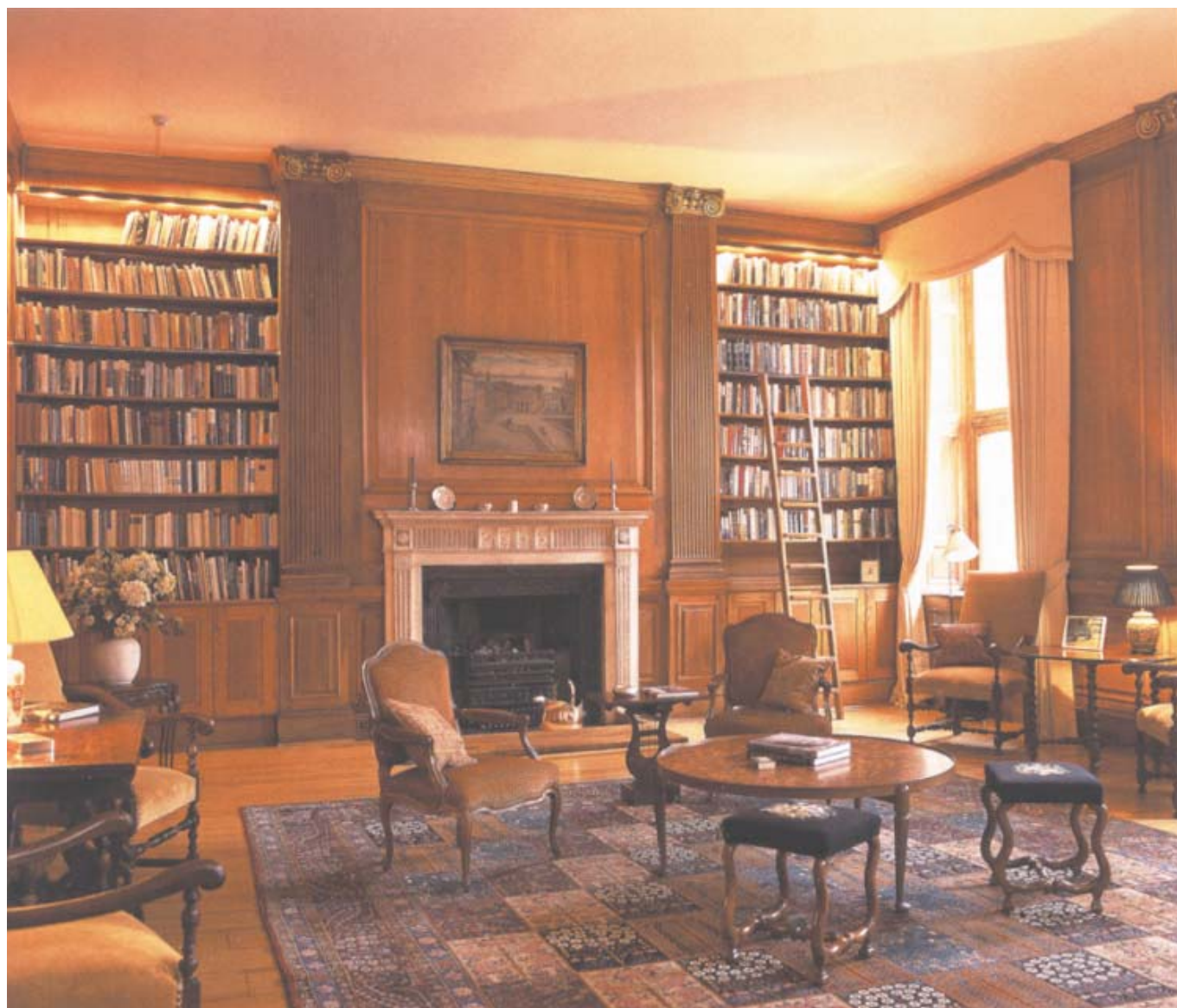
Ett av mottagningsrummen på bottenvåningen har inretts till bibliotek med klassiskt boiserade väggar.

Ett av mottagningsrummen på bottenvåningen förvandlades till bibliotek med träpaneler i klassiskt utförande. I början av 1970-talet sades kontraktet på nummer 29 upp och i stället fick man tillgång till annexet. Köket flyttades från den traditionella placeringen i källaren till annexets första våning, i direkt anslutning till matsalen. Entrén