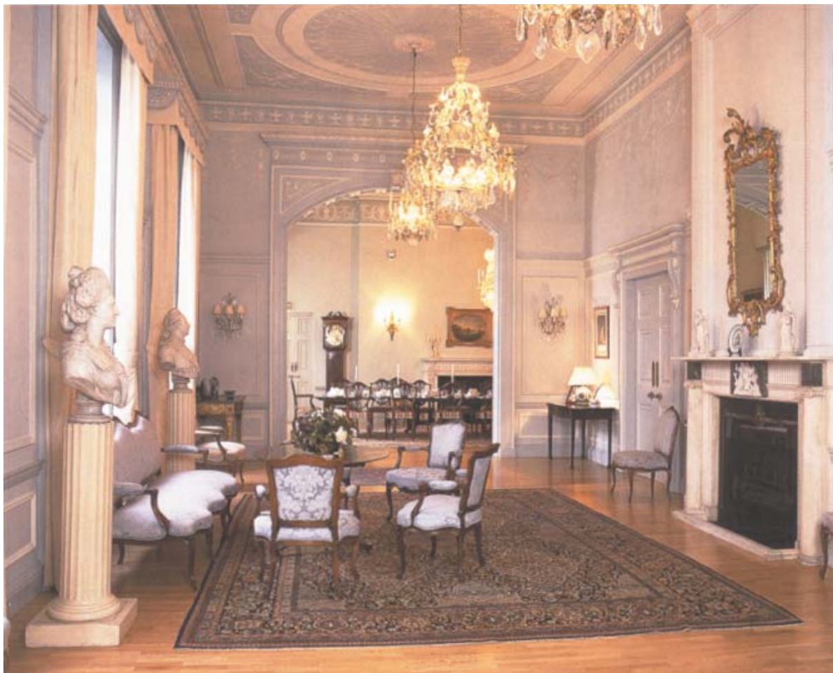
Galleriet, ett av de storslagna mottagningsrummen, med blick in mot matsalen.

Bottenvåningen och våningen en trappa upp upptas av storslagna mottagningsrum. Sovrum och övriga privata rum låg på våningen ovanför dessa, medan tjänstefolket sov på vinden och arbetade i källarens kök och tvättstuga. Bakom huset fanns en liten trädgård och i dess bortre ände stall och uthus, som nåddes via en smal gränd som löper längs kvarterets baksida. Husen var tänkta för ett fashionabelt sällskapsliv. Därför är bottenvåningen och