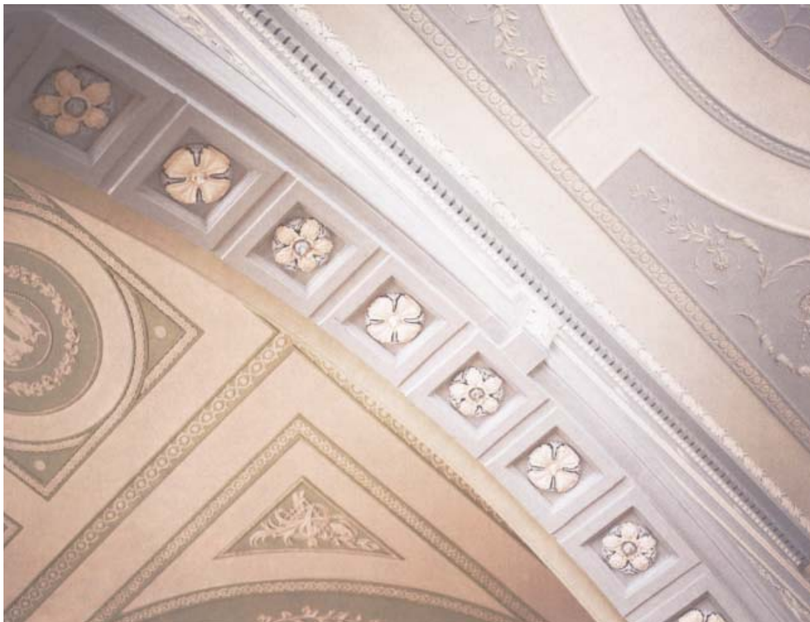
De vackra stuckaturerna i bröderna Adams inredningar har renoverats varsamt.

flyttades från sitt läge mellan huvudbyggnaden och annexet till annexets centrala del, vilket fick det att se ut att vara ett separat hus. Dessutom utrustades annexet med ett andra garage, stort nog för ambassadörens limousine. Annexets tillbyggnad gjorde att fastighetens golvyta nu uppgick till 2 460 kvadratmeter – ett avsevärt antal kvadratmeter för ett Londonradhus.