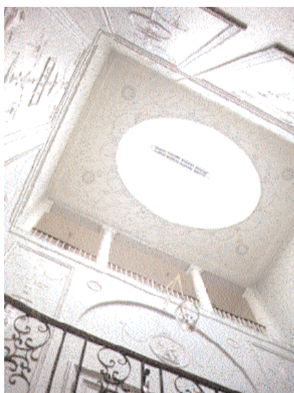
Trapphuset reser sig genom tre våningar mot takets ovala ljusinsläpp.

herrar och gjorde en del spekulationsaffärer som ibland var nära att försätta dem i konkurs. Vid ett tillfälle tvingades de avyttra hyreskontrakt