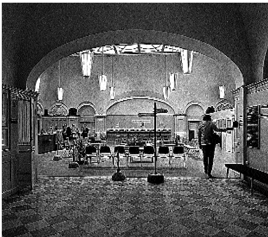
Norrlandsbankens expeditionshall 1971 då den användes av länsstyrelsens passbyrå.

landsbanken i hörnet av Akademi- gränd och Fredsgatan samt Nordstjernans hus vid Drottninggatan och Fredsgatan.