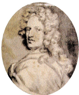
Nicodemus Tessin d.y. Teckning av Per Krafft.

Året 1727 hände två utomordentligt märkliga saker. Det ena var att Sveriges riksdag fattade beslut om att återuppta och slutföra byggnationen av det kungliga slottet i Stockholm efter ett tjugoförårigt byggnadsuppehåll. Det andra var att i Venedig fick en ung arkitektstuderande ett brev från den gamle slottsarkitekten Nicodemus Tessin d.y. i Stockholm, med order om att omedelbart komma hem för att biträda honom vid fullbordandet av Stockholms nya kungsslott. Låt oss se något närmare på de två händelserna.