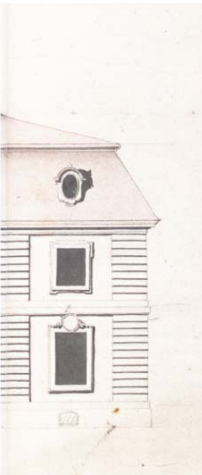
Entréfasaden till Svartsjö slott. Den sju fönsteraxlar långa byggnaden har en för rokokon given tredelning med mitt- och hörnrisaliter. En tvärgående gesims tecknar övergången mellan de två våningarna.

Hårlemans första förslag till ny huvudbyggnad på Fogelviks gods vittnar om beställaren Arvid Horns maktställning.