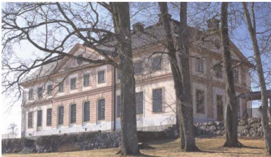
Åkerö, som Härleman ritade för sin nära vän Carl Gustaf Tessin, räknas som en sammanfattning av vad den svenska rokokon står för.

sin hur verkligt god arkitektur skapas. Trots att det är lätt att uppmåla detta förhållande mellan vad vi kan kalla amatörarkitekten och den professionella yrkesmannen bör man kanske vara återhållsam med sina slutsatser. Jag tror att den enkla sanningen är att det inte fanns någon egentlig skillnad mellan de två männens arkitektursyn. Under en följd av år hade de svetsats samman i en gemensam konstsyn när de tillsammans fick fatta en mängd estetiska beslut i samband med återupptagandet av slottsbygget i Stockholm. Ritningsmaterialet från Åkerö visar på en utvecklingsprocess som var gemensam för både uppdragsgivare och arkitekt, men där Härleman var den radikala och konstnärligt pådrivande.