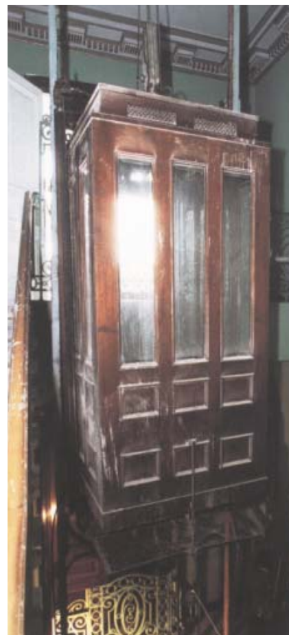
Hissen av tillverkaren Graham Brothers importerades från Sverige och är lika gammal som byggnaden.