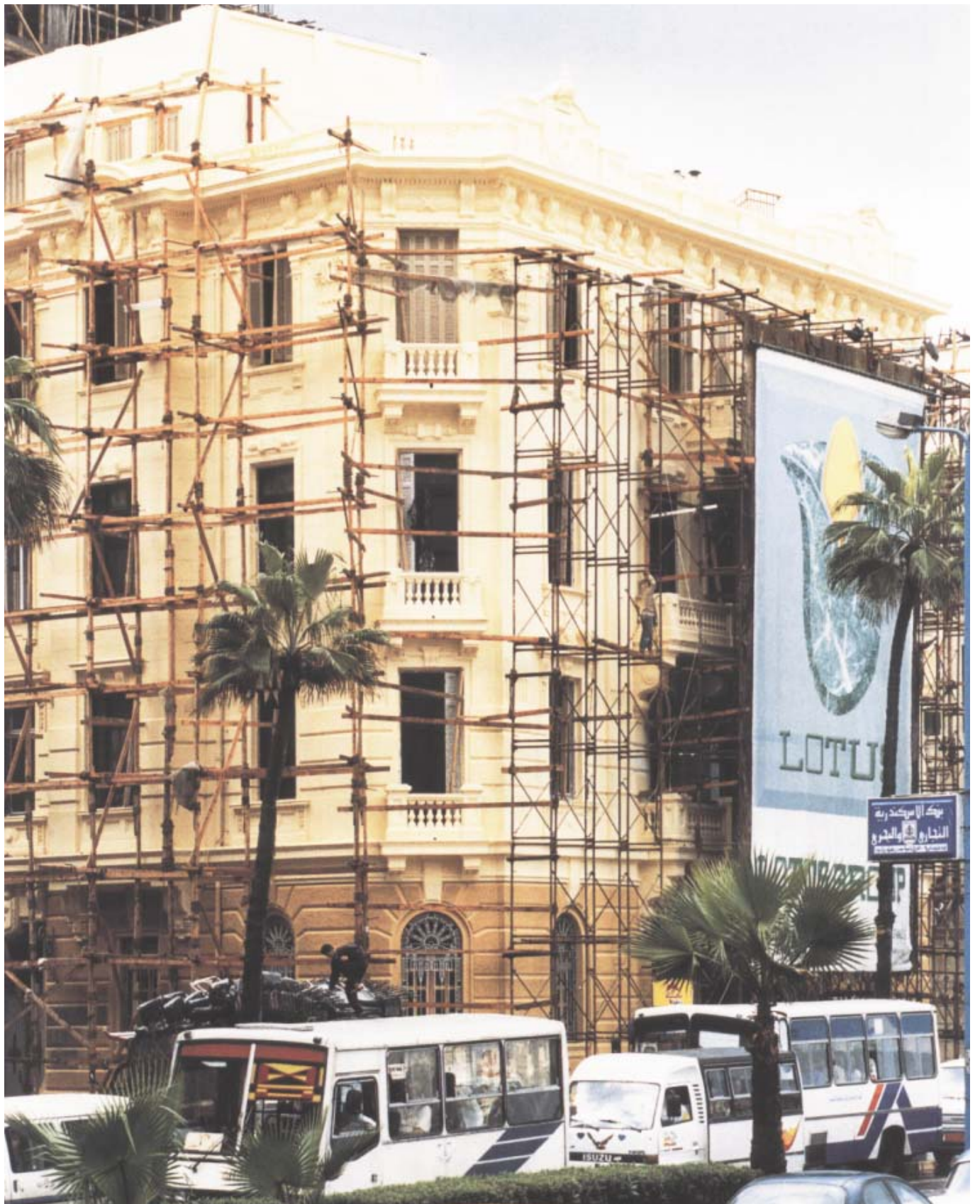
von Gerbers palats i Alexandria