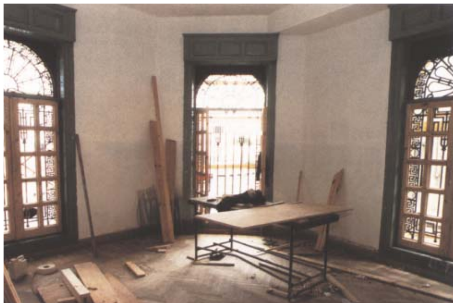
Genomgående i hela fastigheten är de höga fönstren och den rejäla takhöjden, drygt fyra meter.

– Vi blev tvungna att slipa golven och var rädda att vi då skulle förlora den fina nyansen