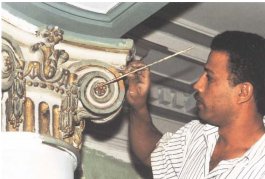
Det finns fortfarande en stor yrkesskicklighet i Egypten, bland annat då det gäller stukaturer och dekorationsmålning.