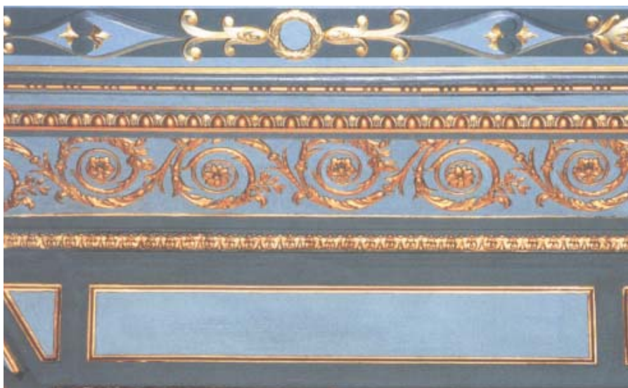
Blå salen, palatsets förnämsta rum, har dekor i guld och två nyanser av blågrönt.

ten och flera importerade från Sverige, har även de renoverats och kommer delvis att återställas till våningen.