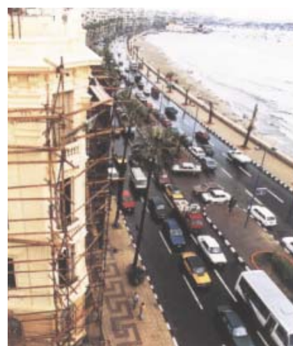
Vinden sveper in mot palatset från Medelhavet över den livligt trafikerade 26 Juli Avenyn.

Huvudingången byggdes för mottagningsceremonier, och den vita marmortrappan leder upp till mottagningsrummet på andra våningen.