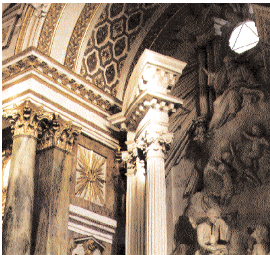
Det genomlysta gudsögat över altaret från Tessins ursprungliga planer har åter öppnats för dagsljuset.

I predikstolen, med dess fladdrande draperi och kraftfulla rörelser, återfinns ett kvardröjande drag av den Tessinska barocken. Den är resultatet av ett samarbete mellan flera franska skulptörer, men det huvudsakliga arbetet kan tillskrivas Jacques Philippe Bouchardon. Apostlastatyerna utfördes