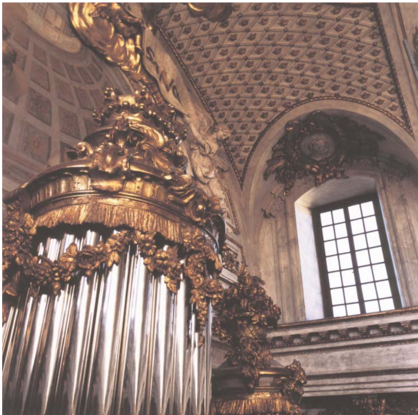
Kyrkans övre fönsterrad har passats in i stickkupor som bryter in i tunnvalvet.

på 1830-talet för den katolska Eugenia-kyrkan, och skänktes till Slottskyrkan 1968. Bänkarna har delvis sitt ursprung i den gamla slottskyrkan. Dörrarna räddades undan branden och togs till vara när slottskyrkan fick en ny bänkinredning 1881.