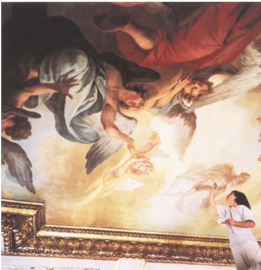
Takets plafondmålningar har befriats från mörknad fernissa och återfått sin ljusa lätta rokokokänsla.

Mycket arbete har lagts ned på restaureringen av takets plafondmålningar. Förutom ytrensning och lagning av ett stort antal sprickor, har delar av den nära 250 år gamla färgen i målningarna åter fäst mot underlaget. Fästningen, konsolideringen, var nödvändig då färgen bitvis hade släppt från putsen och flagade på några ställen. Dessutom har målningarnas gamla fernissa avlägsnats. Den hade mörknat och gulnat så mycket att den förvrängde och kraftigt förmörkade färgerna.