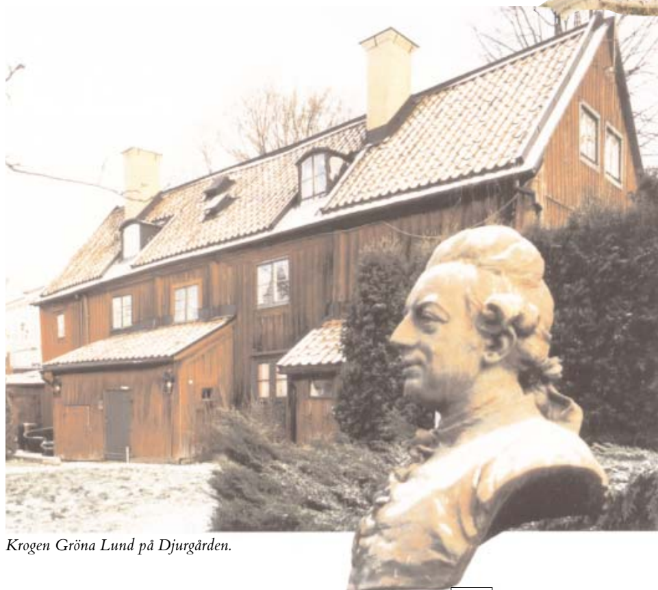
Krogen Gröna Lund på Djurgården.