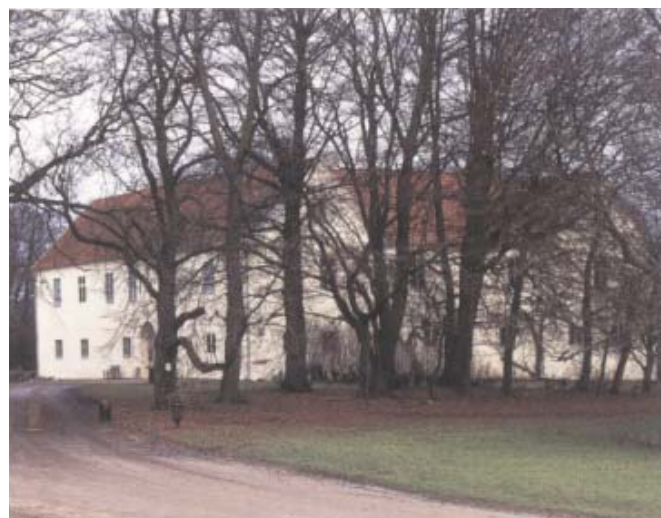
Parken vid Tommarps kungsgård står nu i tur att renoveras.