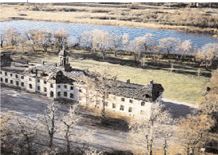
Med Svartsjö slott utanför Stockholm introducerade Carl Hårleman rokokon i svensk arkitektur.