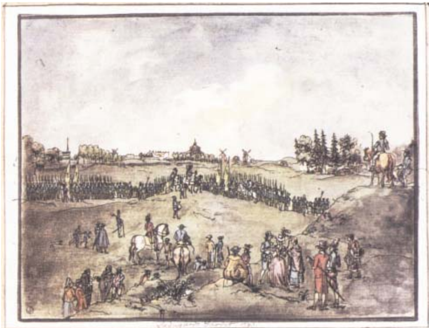
«En Exercis på L. järdet», akvarellerad konturetsning av M. R. Heland efter teckning av Elias Martin 1780.

gränsad av ett långt staket, försett med grindar och portvaksstugor. Den martialiska prägeln på Ladugårdsgärde härstammar från sommaren 1672, då stora militära övningar genomfördes för första gången. Platsen för själva ladugårdsbyggnaden togs i bruk av artilleriet, som på ett eller annat sätt kom att användas fram till mitten av 1900-talet.