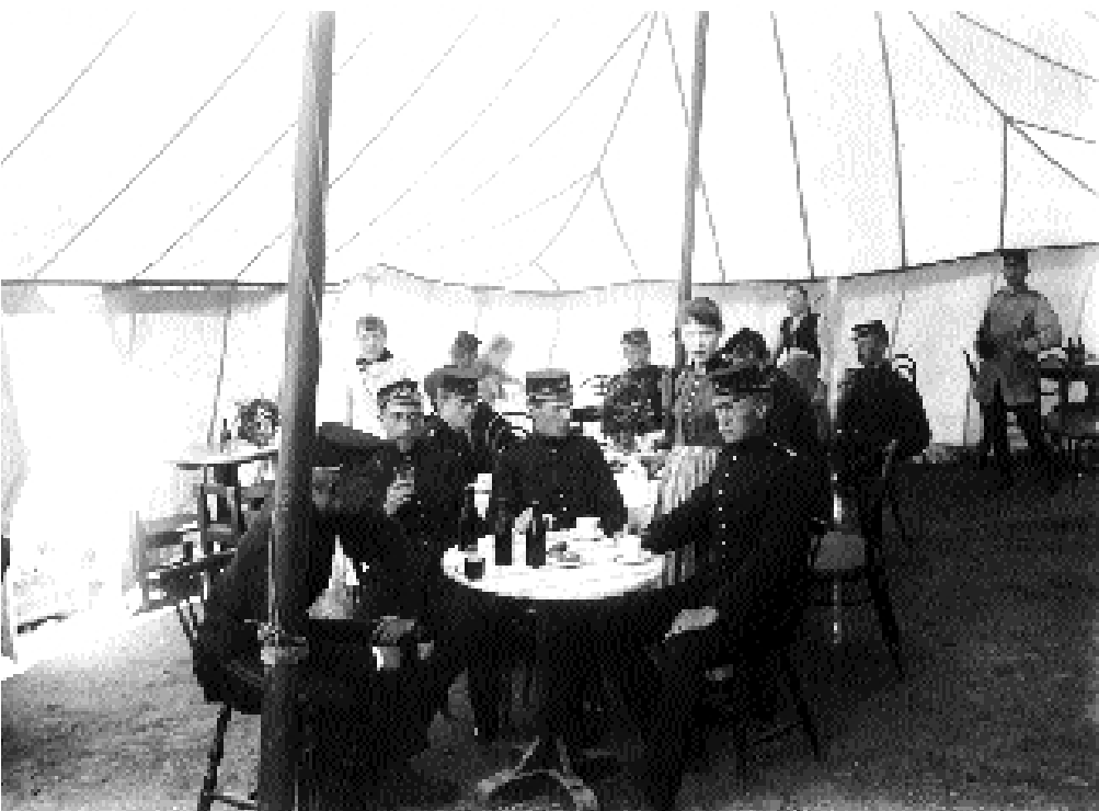
Marketeritält vid övningarna på Ladugårdsgårde sommaren 1892.

museet. I och med den allmänna värnplikens införande byggdes nästan samtliga kaserner på med en våning för att rymma det ökade antalet soldater. Detta innebar i sin tur att användandet av Gärdet ökade.