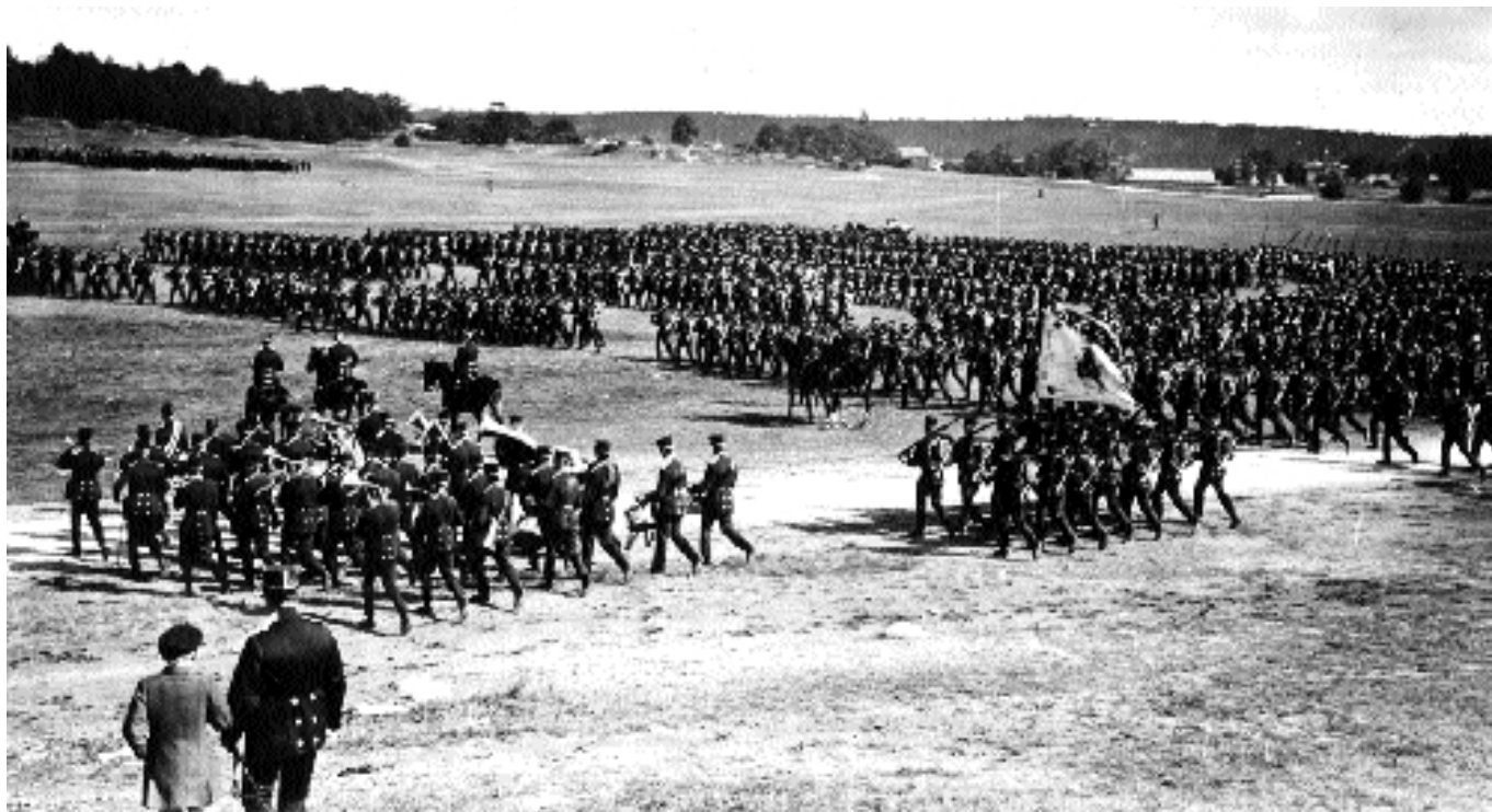
Regementsexercis på Gärdet cirka 1920.

dygn enligt Bloms egen metod för tillverkning av flyttbara hus. Huvudpaviljongen, som eldhärjades 1977 men återuppfördes 1982, utfördes i empirestil med förhöjt mittparti. Paviljongen förseddes med stora rundbågiga fönster, balustrader och klassicerande dekor samt målades i en ljus röd färg.