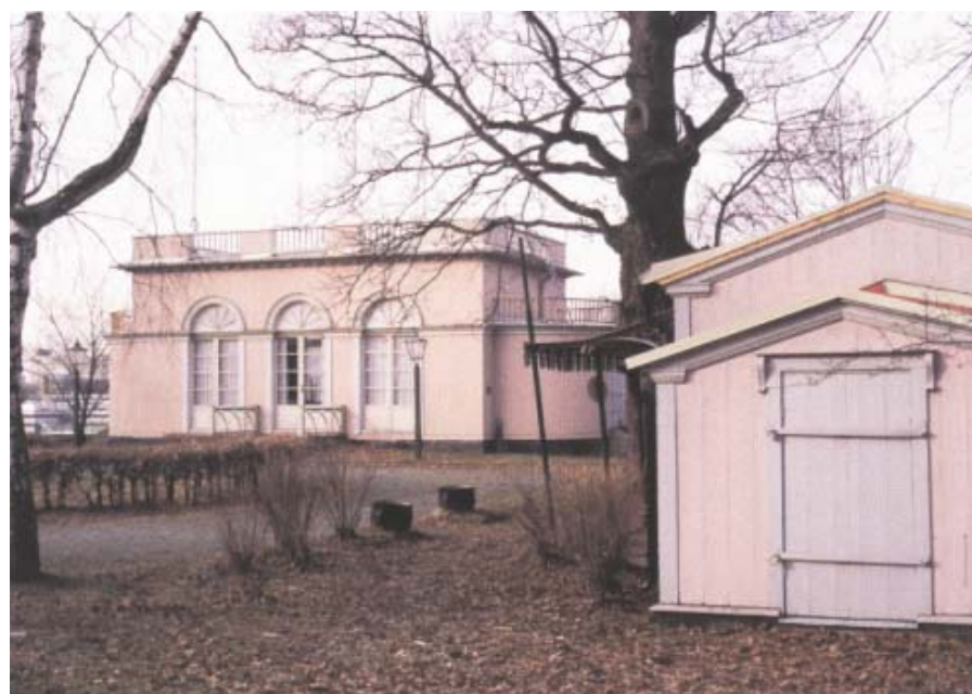
Den ursprungliga paviljongen från 1818 eldhärjades 1977 men återuppfördes av Byggnadsstyrelsen 1982. Sidopaviljongerna, en för kungen och en för kronprinsen, uppfördes 1821–22. Hela anläggningen förvaltas sedan 1993 av Statens fastighetsverk.