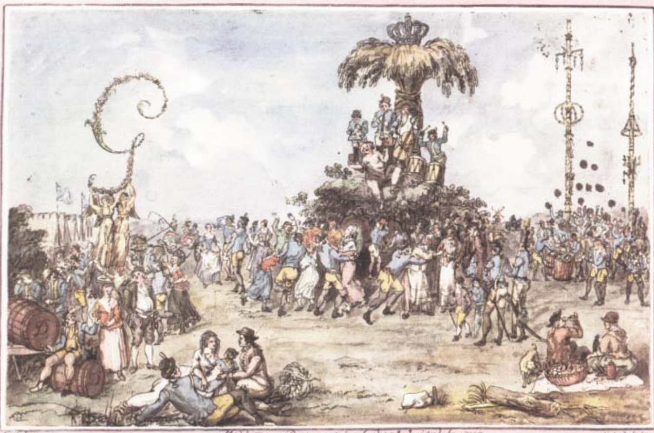
«Midsommar Dagen på Ladugårds jærdet 1785», akvarellerad konturetsning av M. R. Heland efter teckning av Elias Martin.

I april 1697 avled Karl XI och efter en mycket kort tid med en förmyndarregering blev den femtonårige sonen myndig kung. Redan i augusti deltog han i en övning på Gärdet. Det rörde sig om en stridskjutning där skansen besköts med skarpa skott för att visa kungen hur man med koncentrerad eld intog en fästning. Man provsköt också nya kanonmodeller, varvid en granat