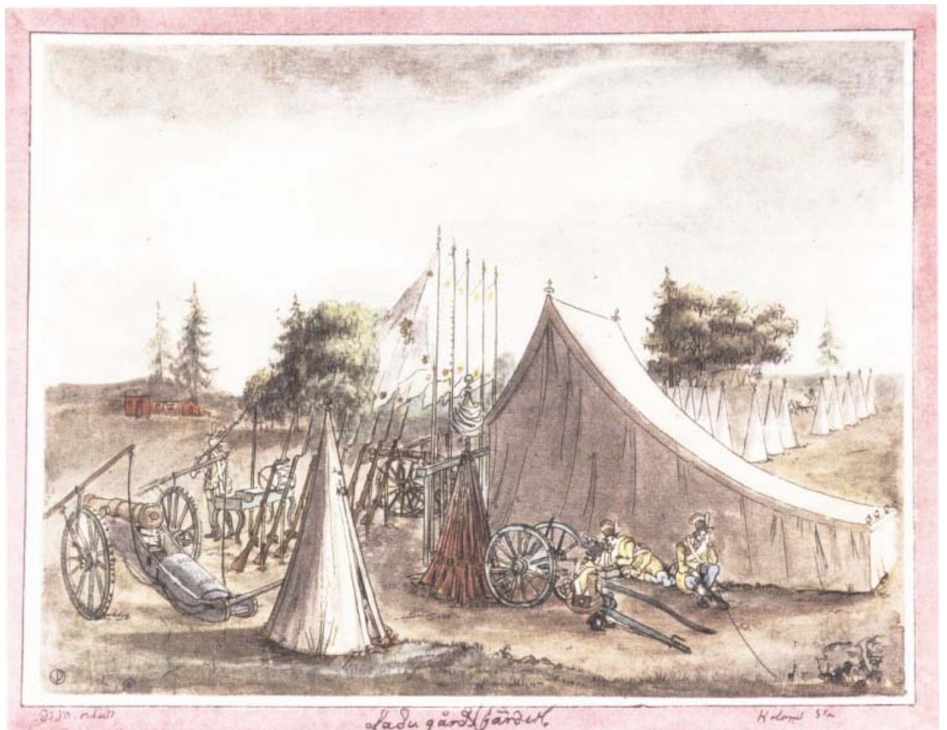
«En vue af Lägret på L. jærdet», akvarellerad konturetsning av M. R. Heland efter teckning av Elias Martin 1780.