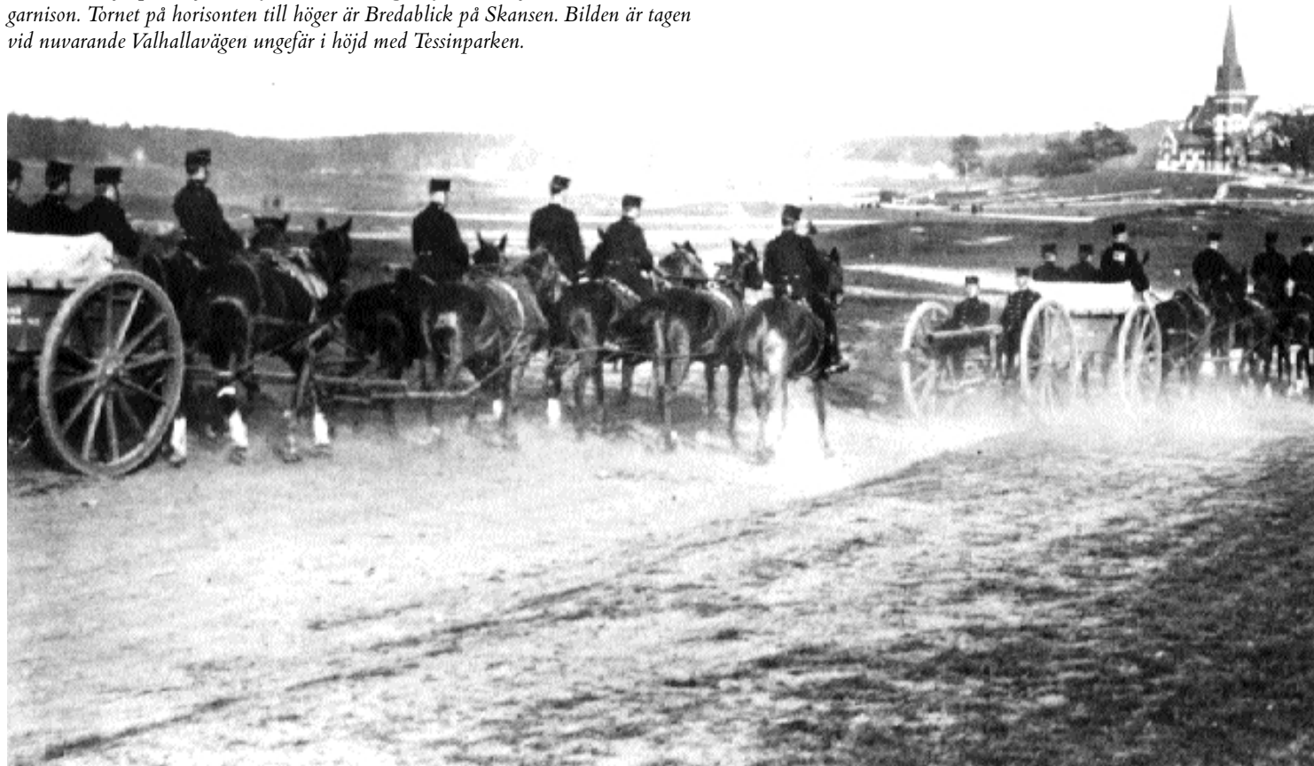
Artilleri på Ladugårdsgården vid sekelskiftet 1900. Mitt i bilden ses den nyuppförda Gustav Adolfskyrkan, från början avsedd som gudstjänstlokal för Stockholms garnison. Tornet på horisonten till höger är Bredablick på Skansen. Bilden är tagen vid nuvarande Vålhallavägen ungefär i höjd med Tessinparken.

År 1640 upplät kronan stora delar av Ladugårdslandet åt den växande staden och marken stadsplanerades. Det nutida gatunätet härrör delvis från denna tid. Gränsen gick vid nuvarande Karlavägen och Grev Magnigatan. Det skulle dock dröja till 1870-talet innan stadsplaneringen slutfördes och dagens gatunät med det så kallade boulevard-systemet bredde ut sig. Kring 1650 etablerades Artillerigården på Ladugårdslandet genom att ett stort tyghus (vapenmagasin) av trä byggdes i närheten av Kronobageriet. Här förvara-