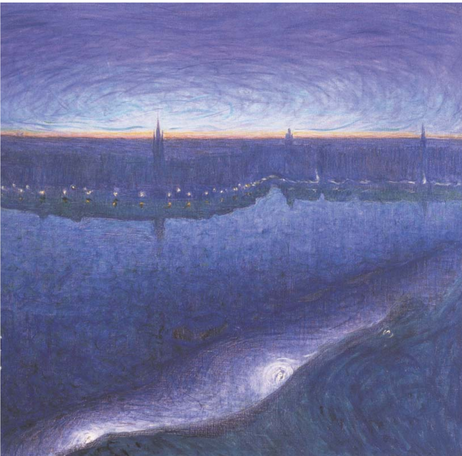
Eugène Jansson: Gryning över Riddarfjärden, 1899.