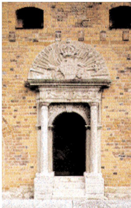
Portalen till krigsmanshuset som inrättades på 1640-talet i nunneklostret sedan klostret stängts definitivt 1595 och byggnaderna dragits in till kronan.