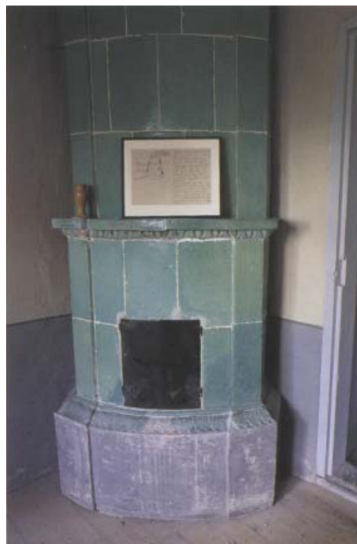
Kammaren med gotlandstillverkad kakelugn från tidigt 1800-tal. Strandridaregårdens två gröna kakelugnar bidrog en gång till att huset räddades undan rivning.