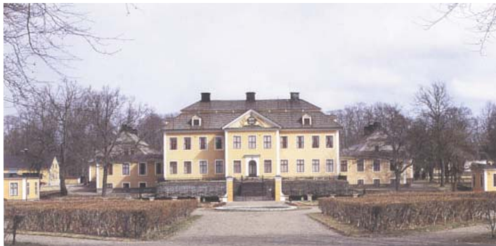
Lövstabruk i Norduppland tar sedan i våras sin värme ur marken.