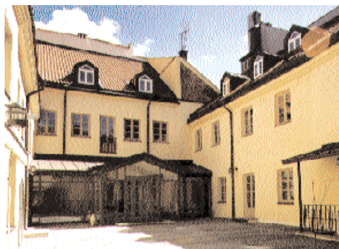
Fastigheten i Vilnius var nära nog en ruin då renoveringen inleddes förra vintern.