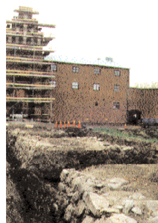
Gamla fundament grävs ut i vallgraven.

nu ompröva utformningen av bron. Oavsett vilken typ av bro som byggs kommer den att byggas på ett sådant sätt att vattencirkulationen i vallgraven förbättras.