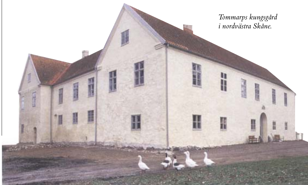
Tommarps kungsgård i nordvästra Skåne.