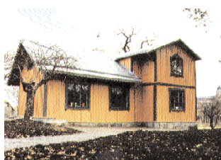
Stora Gustavsborg har återuppstått ur förfallet.

ombyggnad. Byggnadsarbetena har utförts av Fastighetsverkets egna snickare i samarbete med elever från några gymnasieskolor i Stockholmstrakten. Arbetet här har gett eleverna möjlighet till en verklighetsanpassad och praktiskt inriktad utbildning i byggnadsvård.