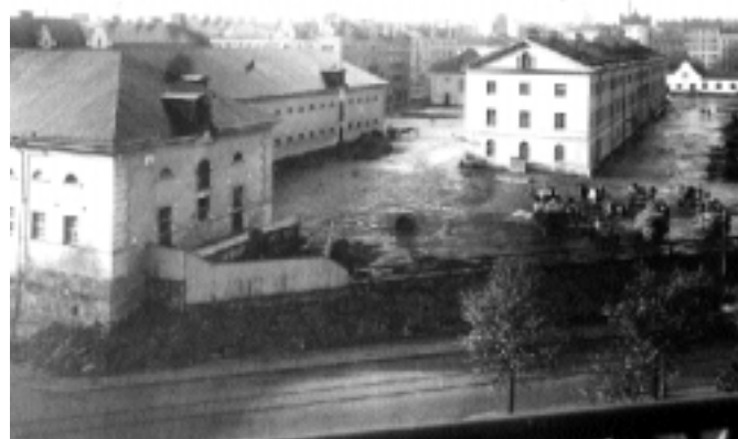
Kasernområdet med Oxenstiernska malmgården till höger i bakgrunden.