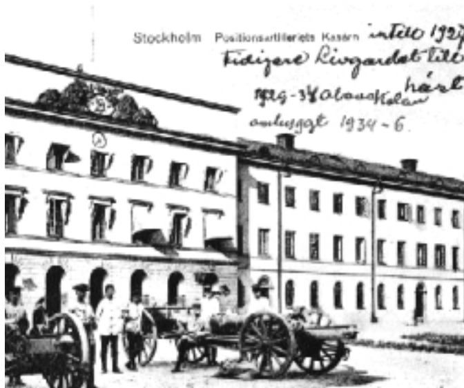
Positionsartilleriets kanonexercis på kasengården. Foto från 1920-talet.