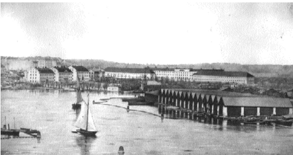
Hästgardets kasern utgjorde ett dominerande inslag i stadsbilden innan den kom att skymmas av Strandvägens husrad. Till vänster Andra livgardets byggnader och i förgrunden Galärvarvet med sina skjul på Djurgården. Foto ca 1850.