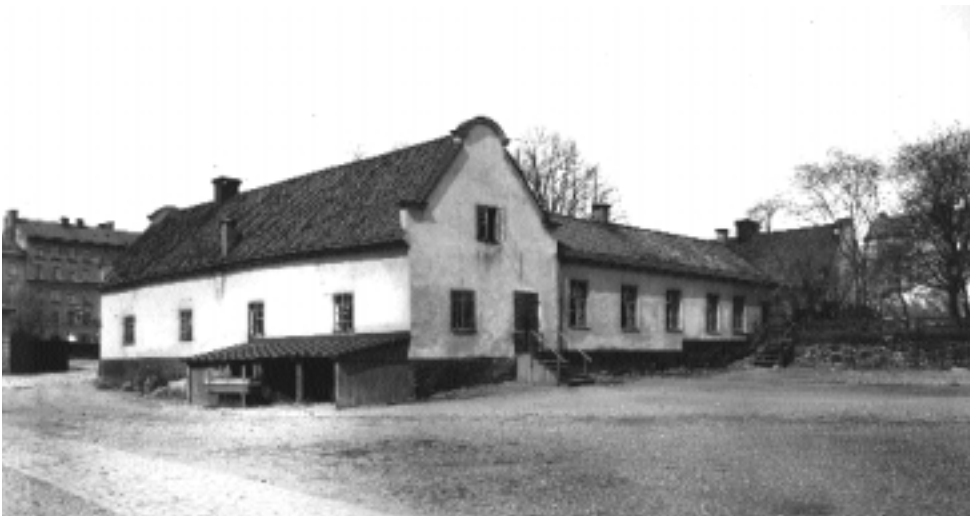
Oxenstiernska malmgården införlivades med kasernanläggningen 1829. I dag finns bland annat Riksantikvarieämbetets fotoenhet i lokalerna. Foto från 1908.