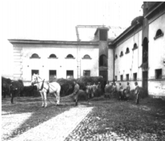
Hö hissas upp på höskullen ovanför Östra stallet med hjälp av talja och rep och en hästkraft. Foto 1898.

en och underofficersarrester. I de östra och västra kaserndelarna fanns på de första två våningsplanen logement, expeditionslokaler för regementets fem skvadroner samt bostäder om ett rum och kök för underofficerare. På översta våningen fanns rustkamrarna (förrådsrum) och ytterligare ett par underofficerslägenheter. Huset saknade senare tiders kaserners korridorsystem och det fanns heller inte några inre förbindelser mellan kasernens tre delar. Logementen var sammanlagt 20 stycken, avsedda för 20 soldater vardera. Varje soldat disponerade en säng, vilket var en epokgörande nyhet. Tidigare hade tvåmannasängar varit det vanliga.