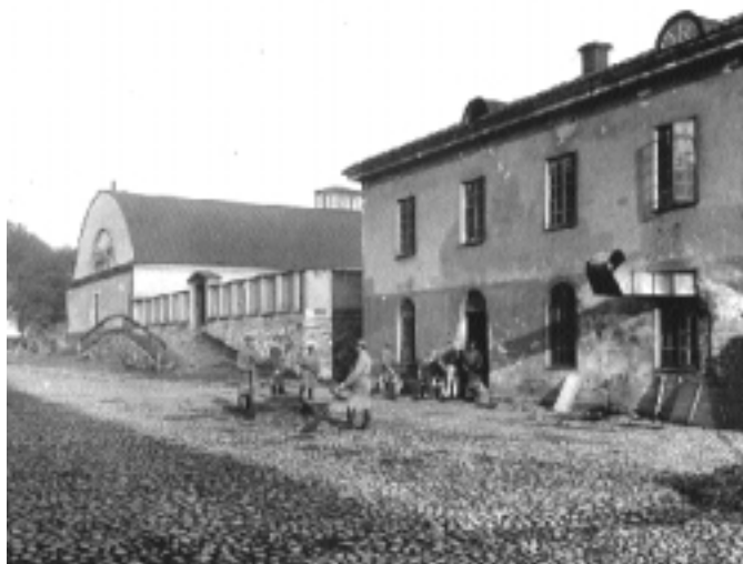
Marketenteri- och matsalsbyggnaden med det äldre ridhuset i bakgrunden. Bakom den sammanbindande muren låg ridplanen. Foto 1897.