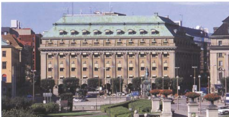
Kvarteret Vinstocken sett från slottet. Till höger syns före detta Centralbanken vars takhöjd och fasader styrde utformningen av Erik Josephsons byggnad.