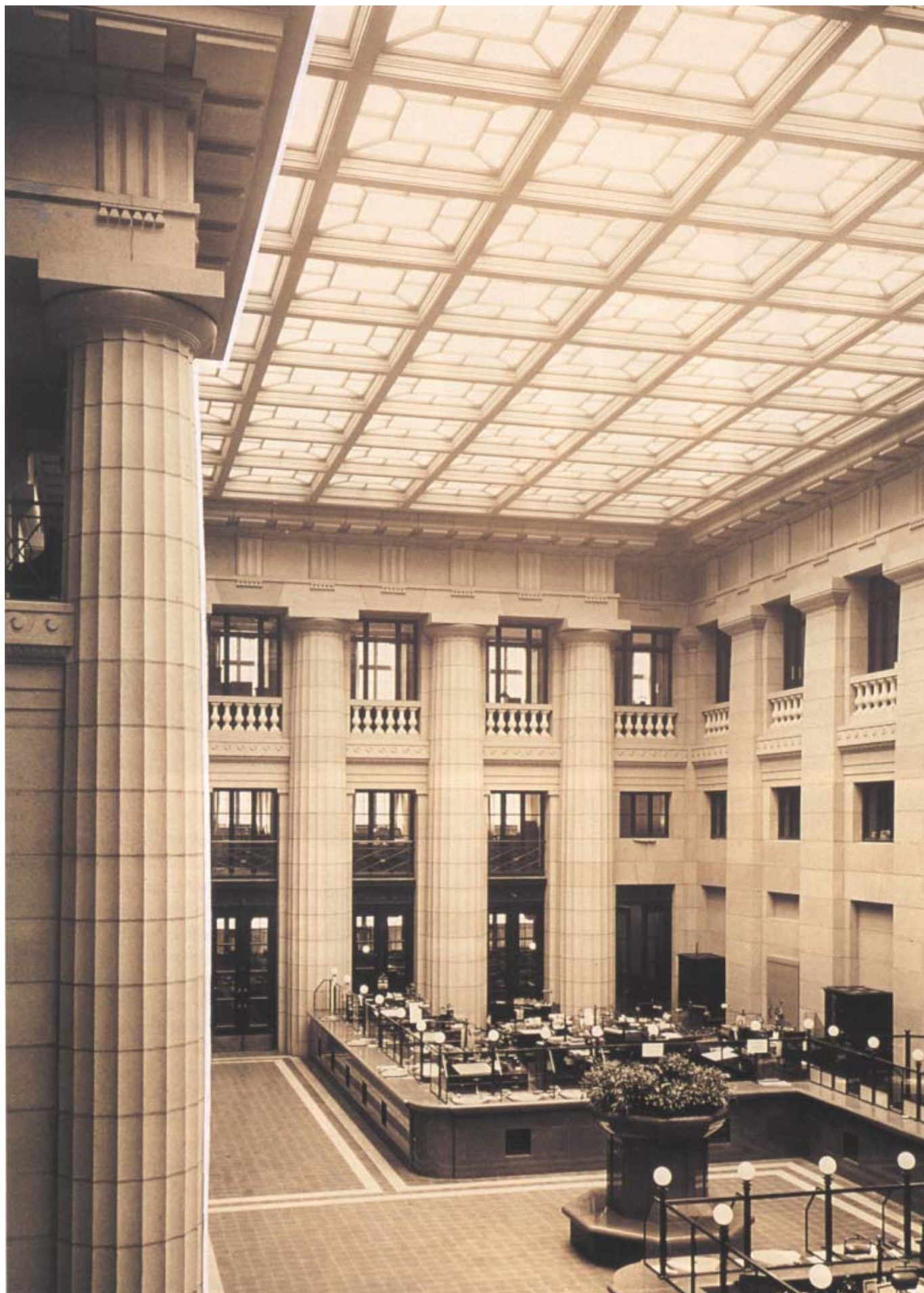
Den stora bankhallen upptar hela gården. Bankdisken var av mörkgrå polerad kalksten liksom luftintaget som var utformat likt en torgbrunn. Fönsteröppningarna släppte ljus in till kontorsrummen via det enorma glastaket. Bankhallen byggs nu om till utställningshall för Dansmuseet.