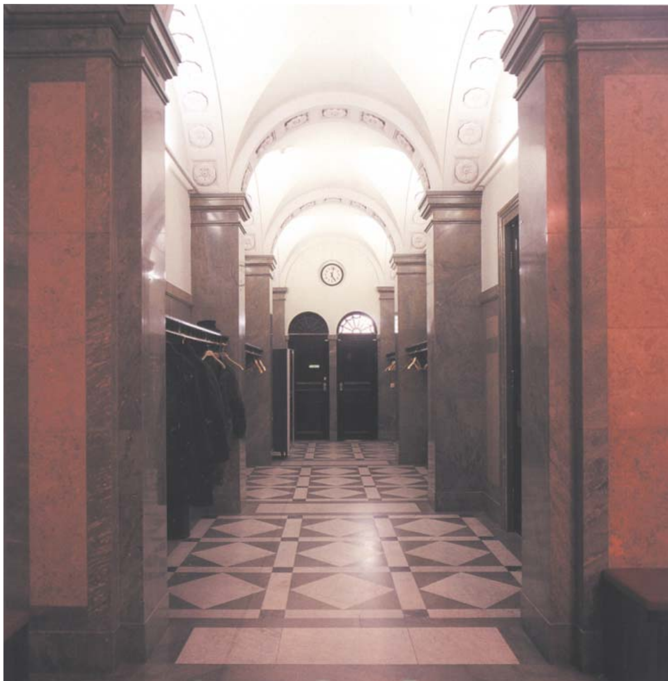
Styrelserummets kapprum i gul, grön och vit marmor har en monumental prägel och framstår i dag i ursprungligt skick.

delar av den gamla direktionsvåningen. I bankens styrelserum återfinns den ursprungliga oxblodsroda putsytan bakom lager av färg. Det pompejanska rummet identifierades och vävspänningen på en vägg togs bort. Fram kom ett antikt landskap med tempel, duvor och jaktscener mellan gula kolonner. Stucco-lustromålningens spegelblanka yta var skadad men återställdes av en skicklig konservator.