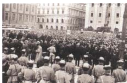
Hungerkravaller på Gustav Adolfs torg den 5 juni 1917.

Arkitekt Carl Bergsten kritiserade prisnämnden och Josephsons förslag i en artikel i tidskriften Arkitektur 1913. Han menade att det var ett misstag att följa Centralbankens takhöjd. De bägge byggnaderna skulle ge verkan av att trycka ned både Arvfurstens palats och Operan. Han menade även att de nya bankhusen skulle bli alltför dominerande vid torget med sina rikt deko-