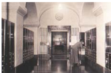
Ovanifrån: Bokföringsavdelningen på plan 6 kunde liknas vid ett modernt kontorslandskap. Spar- och kupongkassan med kalksten på golv, väggar och disk. Depositionsvalvet i betong.

rerade fasader. I förhållande till de andra tävlingsbidragen hade Josephson dessutom lyckats få in ett extra våningsplan som enligt Bergsten gjorde fasadernas fönsteröppningar sammantryckta. Bergsten avslutade sin artikel med «att det utslag prisnämnden fällt är stick i stäf emot en kraftig opposition ibland arkitekterna och ett slag i ansiktet på vår uppfattning om god arkitektur».