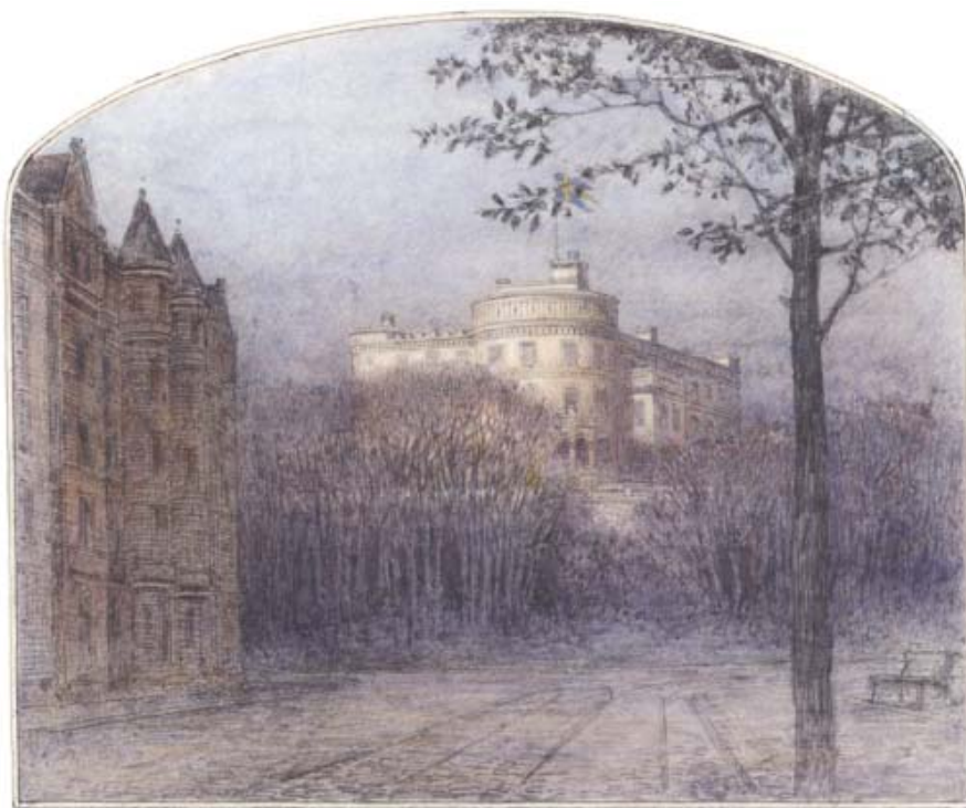
Ferdinand Bobergs förslag till residens för kronprinsparet Gustav Adolf och Margareta, 1905.

När kronprinsparet Gustav Adolf och Margareta återvände till Sverige efter sitt giftermål 1905, tillfrågades arkitekten Ferdinand Boberg angående ritningar och kostnadsberäkningar till ett nytt kungligt residens. Arvfurstens palats skulle övertas av staten, och prins Eugen hade just flyttat därifrån till sitt nybyggda Waldemarsudde, också ritat av Ferdinand Boberg. Platsen för det nya residenset var gamla Skogsinstitutets tomt som i uppgörelsen med staten blev disponibel för kungen. Rit-