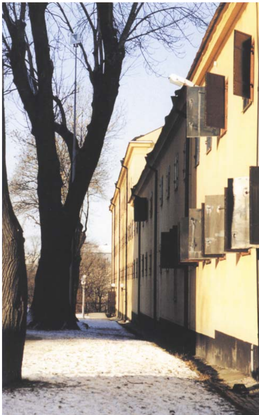
Vid ombyggnaden till museum bevarades byggnadens strama magasinsskäraktar.

Vid slutet av 1700-talet rymde 21 rum tacklage och utredningspersedlar för lika många galärer. Artilleriinventariemakrarna på övervåningen tillhörde 42 galärer. Lejonkulan, som den norra delen fortfarande kallades, utnyttjades för eskaderns reservförråd och kallades varmförråd. Tyghuset hade nu blivit den gemensamma benämningen för hela längan. I fortsätt-