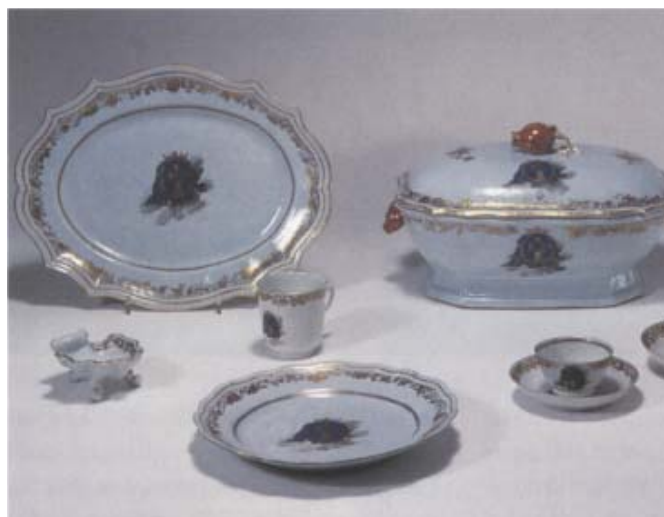
Förlagorna till den Gyllenborgska servisens mönster blev fuktskadade på vägen till Kina och de noggranna kineserna kopierade förlagan exakt med fuktfläckar och allt på varje porslinspjäs.