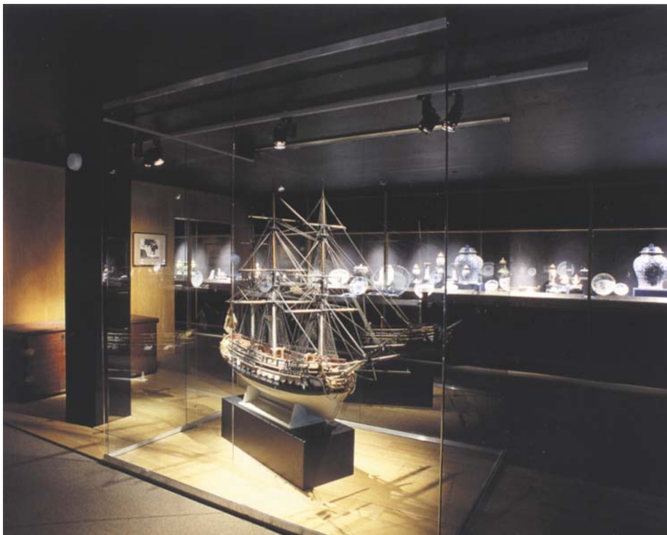
Svenska Ostindiska kompaniet öppnade handelsförbindelser med Kina 1732. På kompaniets fartyg fördes förutom stora mängder te även för tiden omåttligt populära importvaror som porslin, siden, tapeter, lackarbeten och möbler till Sverige.

Det stora problemet med byggnaden är att den är så långsmal, och att det är så lågt i tak i våningsplanen. Men arkitekten gjorde en fin lösning i trapphallen, där hela husets rymd har tagits i anspråk. Och den stora skulpturhallen har ljusinsläpp från två håll.