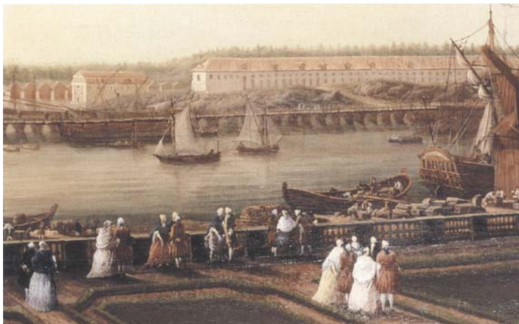
Utsikt från Logården mot Skeppsholmen. Tessins stallänga som byggdes på repslagarbanans grundmurar fungerar nu som tyghus, det vill säga utrustningsförråd, för Stockholms eskaders galärer. Oljemålning av Johan Sevenbom 1760.