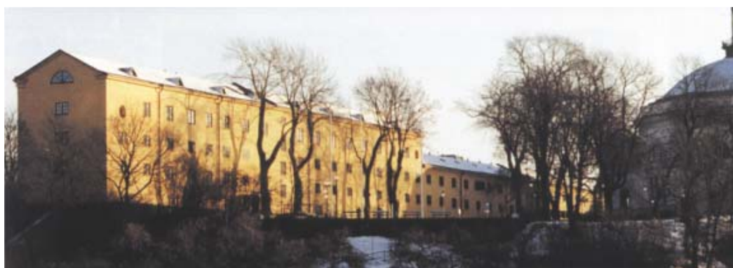
Sedan 1963 rymmer tyghuset Östasiatiska museet. Byggnaden har byggts på med ytterligare en våning vid två olika tillfällen.

År 1663 stod byggnaden äntligen klar. Men bara tio år senare eldhärjades den, och 1680 började flottan sin avflyttning till Karlskrona. Huset hyrdes ut till repslagare och tjänstgjorde som magasin för olika slags inventarier. Det som betecknats som flottans mest omfattande husbygge på Skeppsholmen under hela 1600-talet var redan efter mindre än tjugo år uttrangerat.