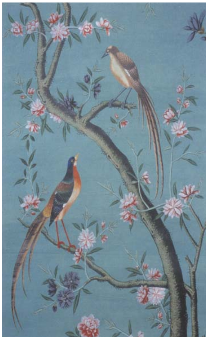
De målade siden-tapeterna från Taxinge Näsby slott hade legat hoprullade på slottets vind i 150 år då de förvärvades av Nationalmuseum på 1930-talet. Färgerna är lika kraftiga och lysande som när tapeten var ny.