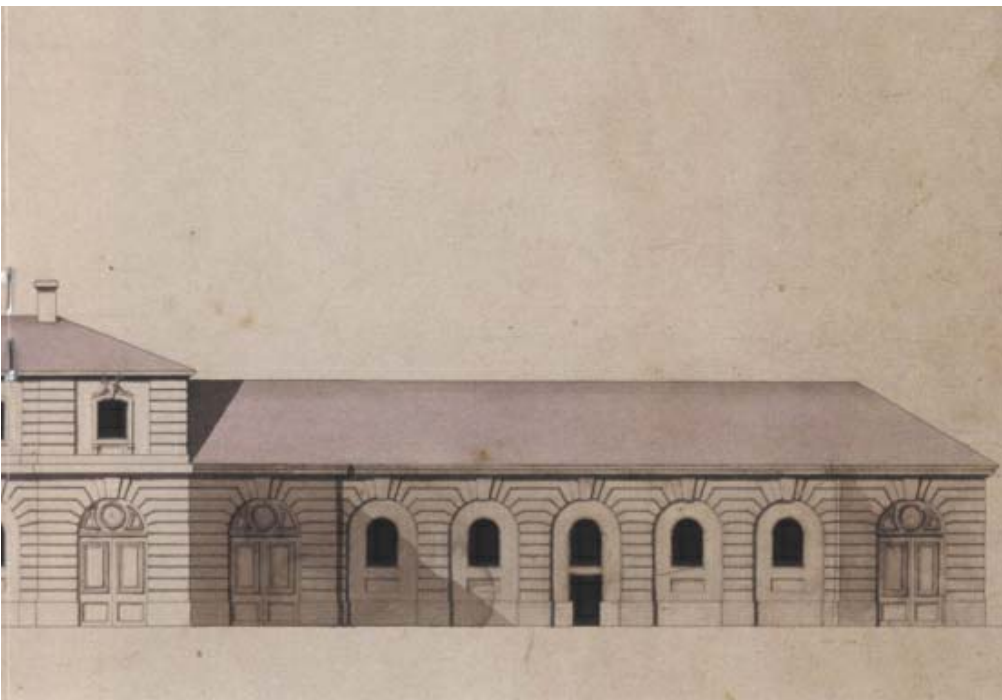
Ritning till stallets utbyggnad tillskriven Carl Fredric Adelcrantz. Längan till vänster på ritningen utgör det ursprungliga stallet och kallades Ridstallet. Vaktflygeln i mitten och det så kallade Svarta stallet till höger uppfördes på 1770-talet.