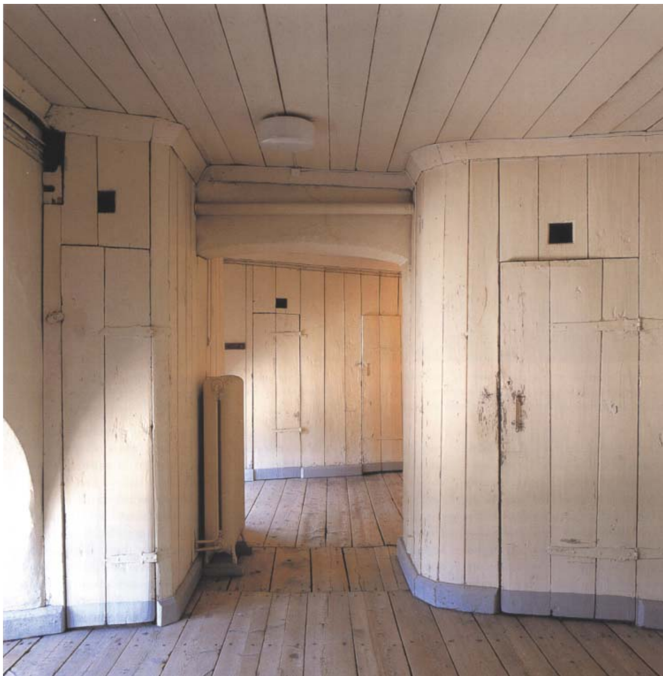
I hallen på första våningen i högvaktsflygeln lever 1700-talet kvar. I släpljuset från de halvrunda fönstren framträder de handbilade träpanelernas levande yta.