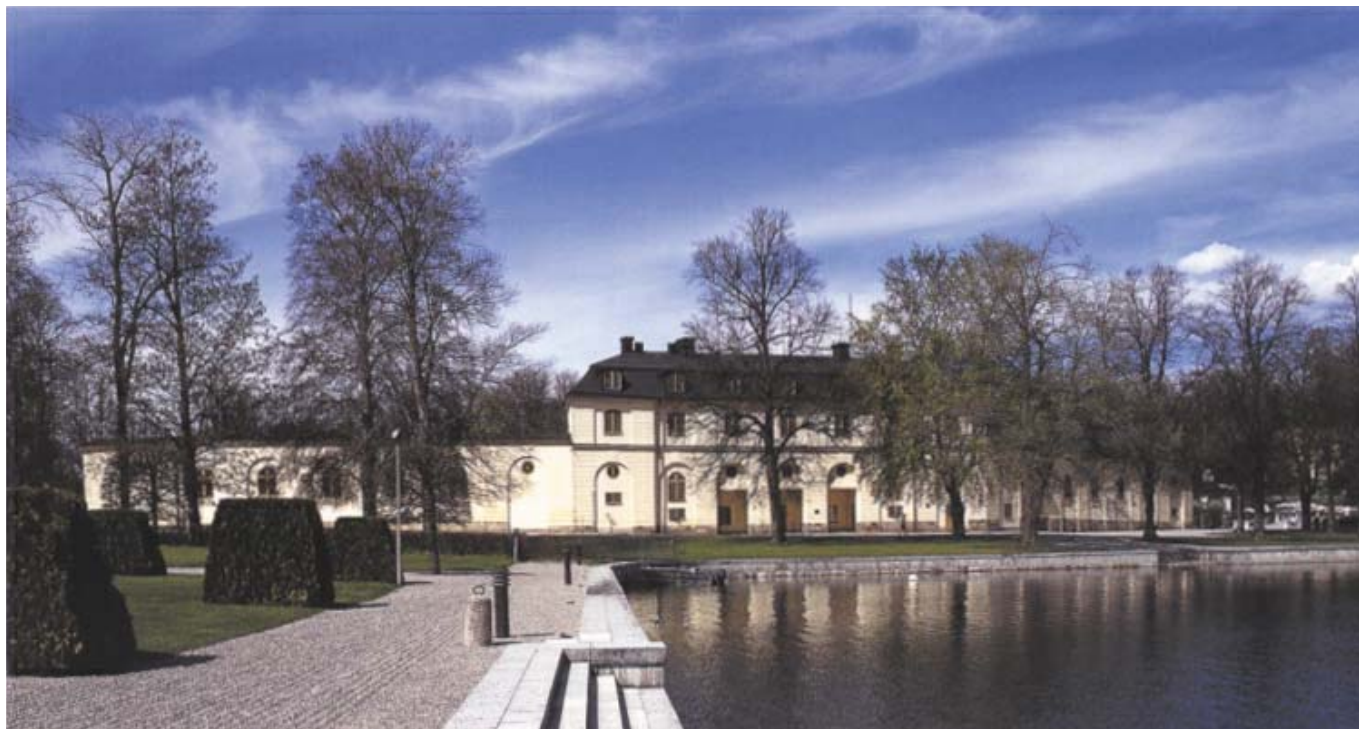
Högvaktens flygel vid Drottningholm 1997. Under de runda fönstren har portarna ersatts av en sluten mur, men fasadens bågar och rusticering bevarar ändå traditionen från Hårlemans arkitektur.

ningholm skapades siktlinjer som ger utblickar och förbinder hållpunkter i landskapet. Det var helt i kungens smak att låta slottet bli den centrala blickpunkten i vyn mot Drottningholm och då fick inte Corps de Gardet skymma sikten.