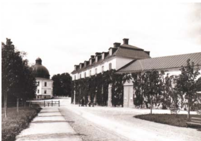
Bommen som spärrade den gamla vägen förbi slottet alltsedan 1780-talet, möjligen ännu tidigare, fanns kvar ända till 1927. Foto från 1925.