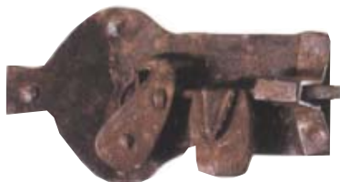
1700-talslåsen i dörrarna fungerar ännu i dag.