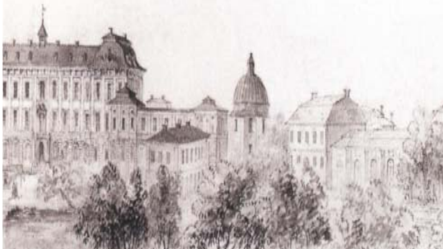
Drottningholm med den 1755 uppförda Corps de Garde-flygeln framför slottet och det utbyggda Slottsstallet mittemot. Elias Martin tecknade vyn innan Corps de Gardet revs 1787.

den stora vinden finns så kallade säng-lavar för båtsmän, där uppskattningsvis 18 man i den ena, kanske 10 i den andra, kunde ligga axel vid axel i säng-halmen. Lavarna sluttar något utåt, och vid kanten av lavarna finns 'gevärstån-dare av järn'. På den andra kortväggen finns en stor öppen spis med plats att torka kläder och annat som kunde hängas framför elden. Ett par mindre rum intill, avsedda för överskepparen och arklimästaren, har bevarats intakta med kakelugnar och garderober. Med hjälp av bevarade inventarieförteckningar kan vi tänka oss rummen inred-da. Väggarna är klädda med pappersta-peter och träpaneler. Lite enklare rum saknar tapeter och bröstningen är målad direkt på muren. Möblemanget består av ett oftast omålat bord, en grå- eller brunmålad stol med överdrag och omålat 'dubbelsängställe' som ibland har omhängen av rutigt tyg. I sängen en tagelmadrass med randigt var, ett bolster och en långdyna stoppad med fjäder och en filt, ofta vit med ränder i blått eller grönt. Den enda belysning-en är en ljusplåt av mässing på väggen, och sist i förteckningen upptas en natt-potta av tenn, ett tvättfat likaså av tenn och en eldsats, det vill säga eldgaffel och skärm. Fram till mitten av 1800-talet anges oförändrat trettio-tre rum i