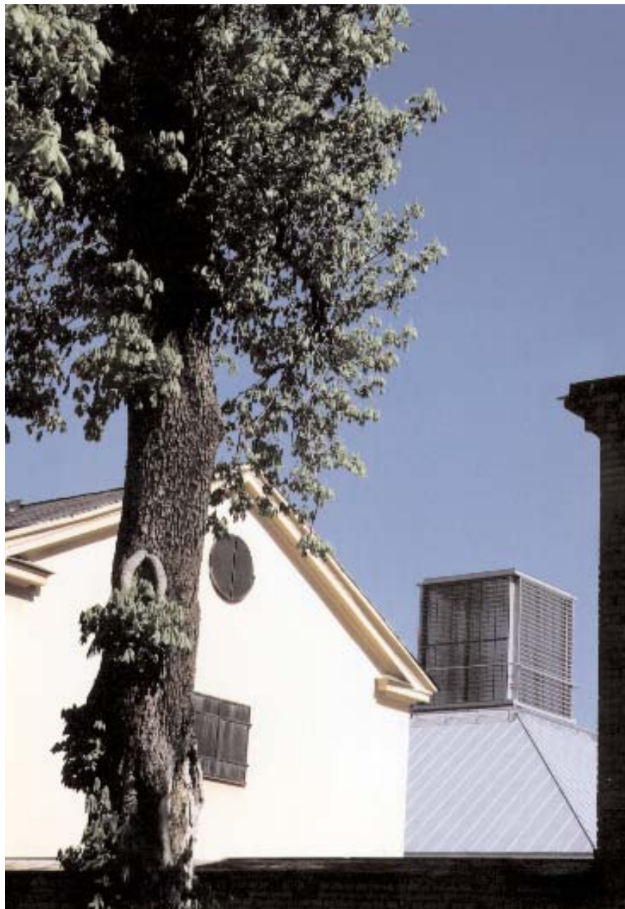
Den nya museibyggnaden ansluter i både skala och formspråk till den befintliga arkitekturen och Skeppsholmens klassicistiska arv.

Tillkomstprocessen har varit lång och komplicerad – som alltid då det gäller projekt av den här storleken och digniteten. Nybyggnaden för de två museerna är det största projekt som Statens fastighetsverk haft ansvaret för under senare år, och det är Fastighetsverkets byggprojektgrupp under ledning av Peter Ohrstedt som har fungerat som beställare och lotsat museiprojektet förbi alla grynnor och skär på vägen från idé till färdig byggnad.