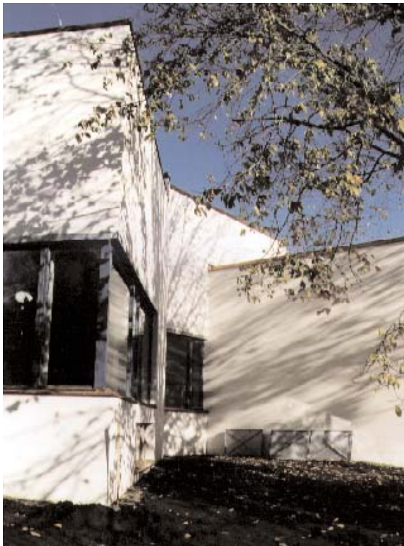
Hommage à skandinavisk modernism. Den nya administrationsbyggnaden för Arkitekturmuseet har ritats av Rafael Moneo och är förbunden med det gamla exercishuset genom en glasad gång.