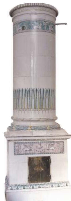
Kakelugn från tiden omkring 1800. I residenset finns ett antal ugnar från denna tid, flyttade från någon äldre byggnad i staden. Kanske har de stått i 'Prinshuset', residensets företrädare på tomten.

Bottenvåningen med entré från Kungsbron där Erik Dahlberghs byst vakar över de inträdande, är husets huvudvåning och helt inrättad för representation. Från entrén kommer man in i en stor 'living hall' kring vilken de olika rummen grupperar sig. Omedelbart till vänster finns två rum som ursprungligen var herrum men nu är kungliga gästrum. I adjutantrummet återfinns en empirekakelugn. Rakt fram genom hallen ligger den stora matsalen med plats för 104 sittande gäster. Den har ett rikt dekorerat stucktak med marina symboler och Gustaf v:s namnchiffer. Innanför matsalen ligger lilla matsalen med havsutsikt. Den var från början frukostrum och här har numera blekingekonstnärer möjlighet att ställa ut sina arbeten. Från den stora matsalen når man rokokorummet eller salongen som det tidigare kallades. Sitt namn har rummet efter rokokomöblemangent; här finns bland den konstnärliga utsmyckningen G. E. Schröders målning «De fyra riksständerna». Utanför rokokorummet finns en öppen loggia mot havet. Det sista av representa-