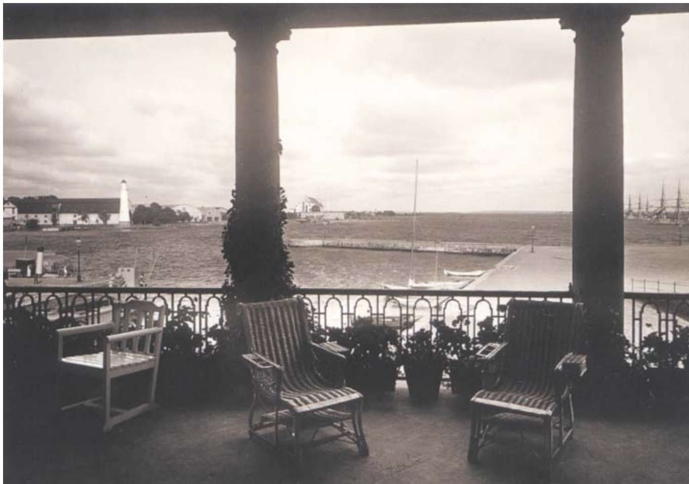
Loggian utanför Rokokorummet på ett fotografi från omkring 1930. På reddan ligger skeppsgossekårens övningsfartyg Najaden och Jarramas.

tionsrummen på bottenvåningen är förmaket eller pelarsalongen som är inrett i gustaviansk stil.