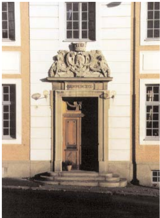
Residensets entréportal kröns av Blekinges vapen.

bostaden äro däremot af den art, att de enligt Eders Kungl. Maj:ts befallningshafvandes förmenande icke lämpligen kunna afhjälpas genom reparation af den gamla byggnaden [...], och sådan den nu finnes, är landshöfdingebostaden i Blekinge län såväl hvad utrymme som soliditet och inredning beträffar tvifvelsutan den sämsta i riket.»