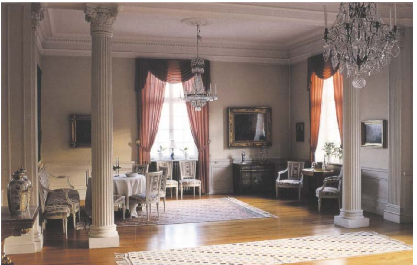
Rokokorummet (ovan) och Pelarsalongen (nedan) är två av de mest praktfulla rummen i representationsvåningen. Den fasta inredningen utformades av Gustaf Lindgren i rokoko och gustaviansk stil och har möblerats i överensstämmelse med respektive rums stilhistoriska särart.