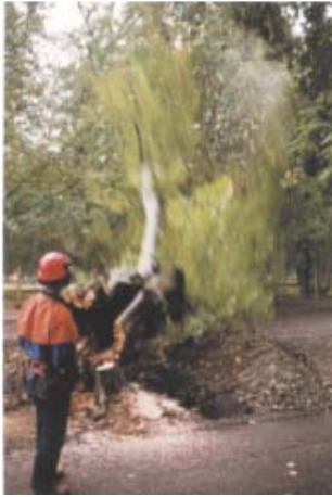
Drottningholms lindar har fallit.