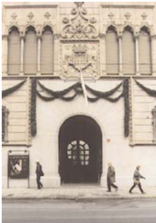
Hallwylska palatset fyller 100 år.

Skeppsholmsbron ska återfå sina gyllene kronor och parställda lyketolpar. Bron kommer därmed att se ännu ursprungligare ut än den gjort de senaste sjuttiofem åren.