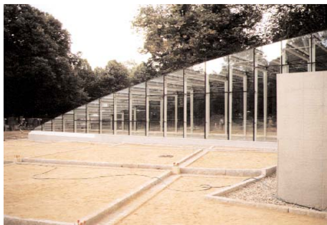
Nordsidans lanternin med Einar Höstes strama rutnät i grå granit.