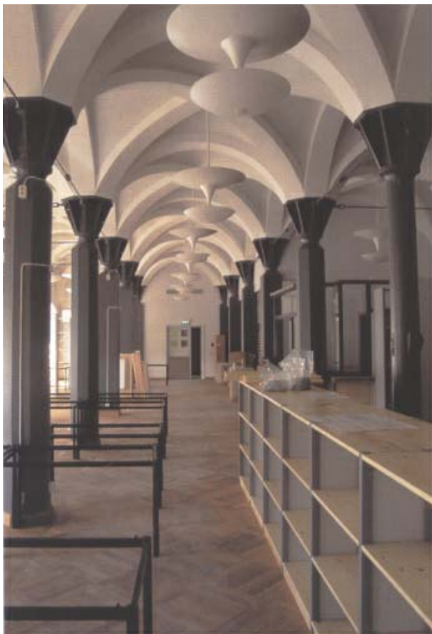
Den nya speciälläsesalen är inrymd i ett kryssvälvtt rum på första våningen.