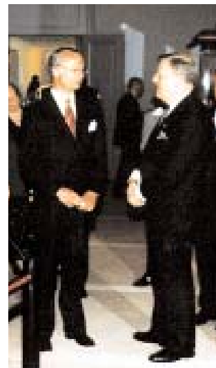
Kung Carl XVI Gustaf i samtal med rektor Stig Strömholm.