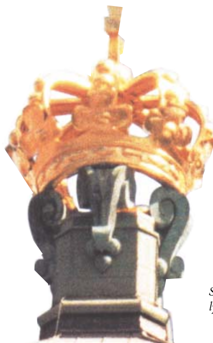
Skansen Kronan lyser av bladguld.

I juryns motivering heter det bland annat: «Ombyggnaden ... har präglats av en genomtänkt metodik för att styra miljöarbetet. Särskild uppmärksamhet har ägnats åt att uppnå en effektiv energianvändning samt att styra såväl det ingående som det utgående materialflödet ... intressant är ansatsen att anpassa byggnadens energianvändning utifrån ett livscykelperspektiv.»