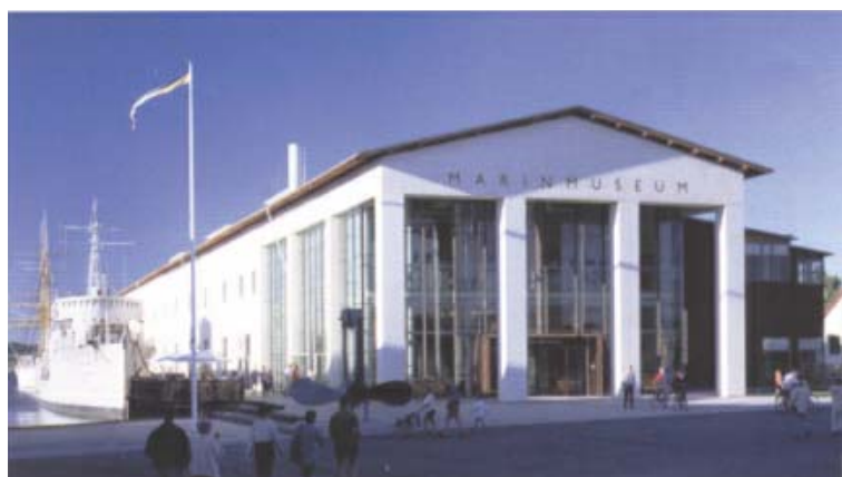
Marinmuseum i nya lokaler på Stumholmen.

Att det nya Marinmuseet fungerar som en turistmagnet för Karlskrona kan man lugnt konstatera. Redan under de första veckorna hade museet lika många besökare som man tidigare haft på ett helt år då museet låg inrymt i de tidigare lokalerna i Skeppsgossekasernen.