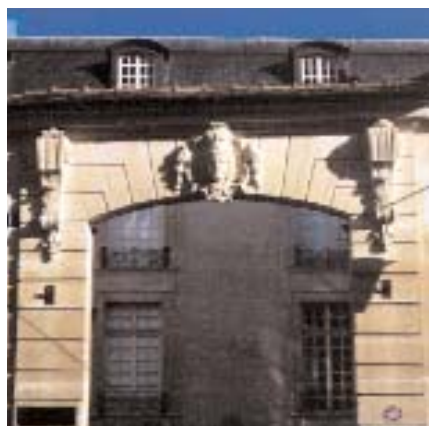
Entréportalen mot rue Payenne lockar besökaren in på palatsets gård.

Det var i detta kulturpolitiska klimat som svenska staten 1965 på kulturrådet