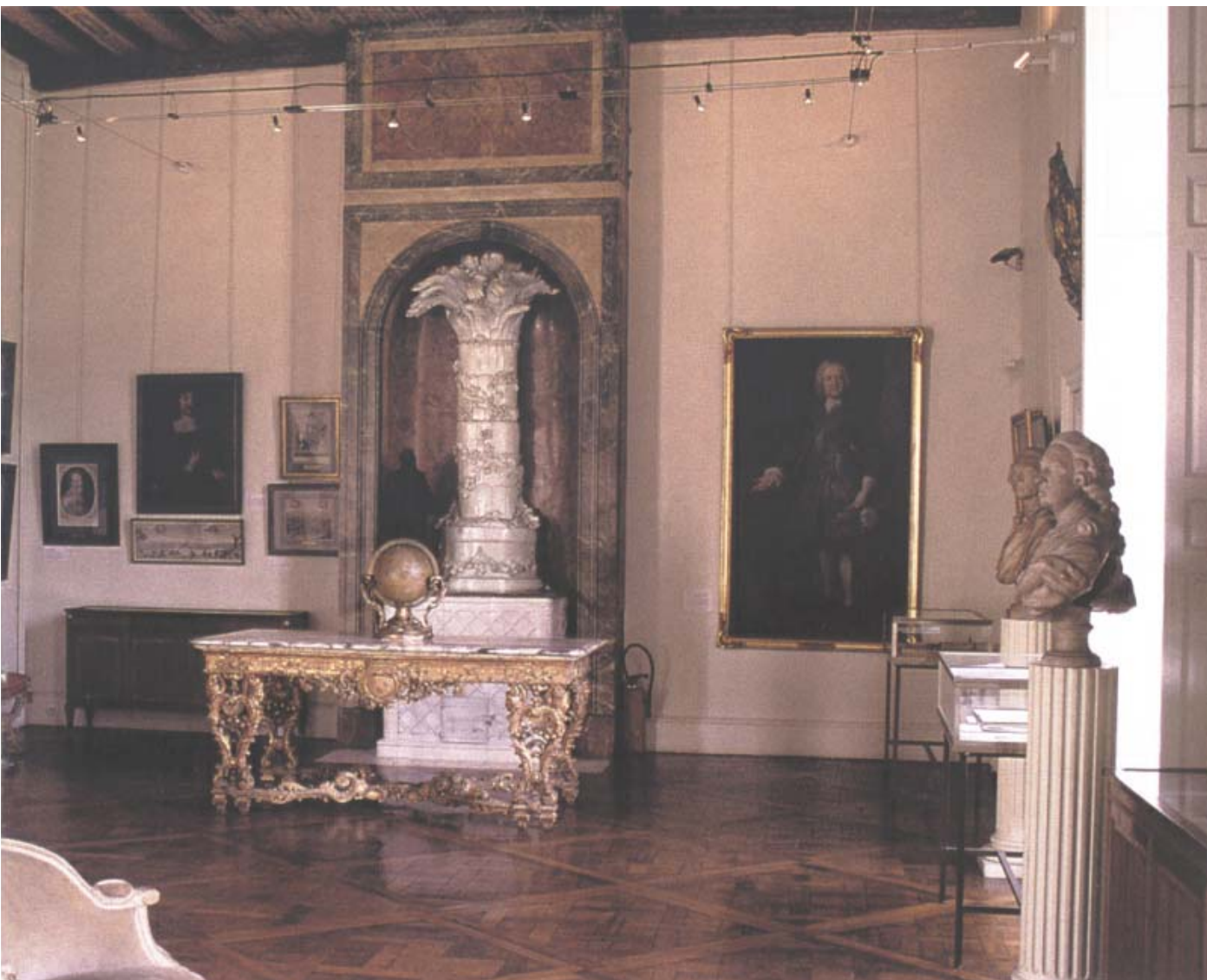
Drottning Kristinas salong – ett av palatsets mest magnifika rum med svensk och fransk konst, skulptur och möbler från 1700-talet. Palmkakelugnen från 1700-talets mitt har överlevt den franska revolutionens skövling av palatsets fasta inredning.