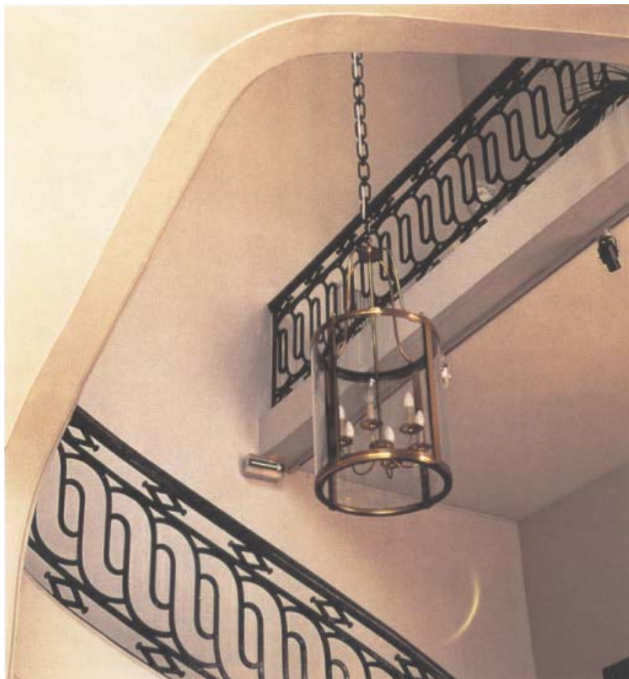
Palatsets eleganta trapphall med vackra konstsmidda räcken.

nyutkommet arbete om fajans- och porslinsstillverkning i Paris under 1700- och 1800-talen. Kakelugnen är den enda inventarie i Hôtel de Marle som överlevt franska revolutionen.