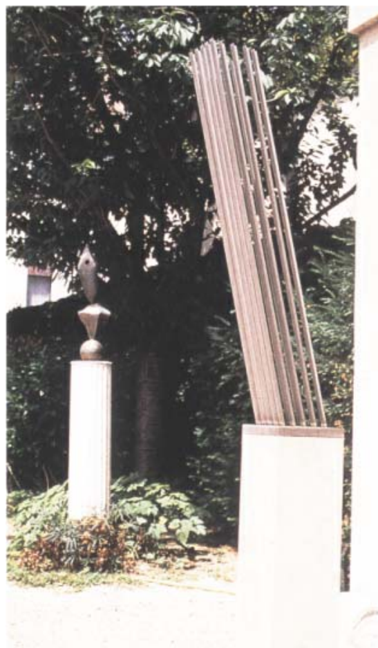
I skulpturträdgården återfinns verk av svenska skulptörer.

Hôtel de Marle följer ett typiskt mönster för franska stadspalats under 1600- och 1700-tal, anlagda entre cour et jardin – 'mellan innergård och trädgård'. Huvudentrén vänder sig mot en stenbelagd gård som inramas av två flyglar med murar och grindar mot gatan. I södra flygeln öppnar sig den stora portalen med paradtrappan från 1775 och till höger, i norra flygeln, ligger en mindre entré med trappa försedd med vackert smidesjärn från 1694. Paradtrappan leder till huvudvåningen där den stora salen för tillfälliga utställningar är belägen. Denna öppnar sig med höga franska fönster mot den muromgärdade trädgården. I trädgården finns en permanent samling där verk av svenska skulptörer verksamma i Paris under det senaste århundradet är utställda. Sommartid är institutets