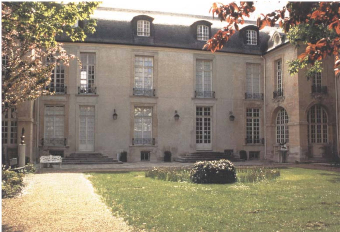
Palatset öppnar sig med höga franska fönster mot den muromgärdade trädgården.

le var Hôtel de Marle redan fyrtio år gammalt! Husets karakteristiska takstol 'à la Philibert de L'Orme', med formen av en upp-och-nedvänd båtköl, kan dateras till senare hälften av 1500-talet. En av de vackra takbjälkarna i huset bär monogrammet 'C. M.' efter Christophe Hector de Marle, rådgiva-